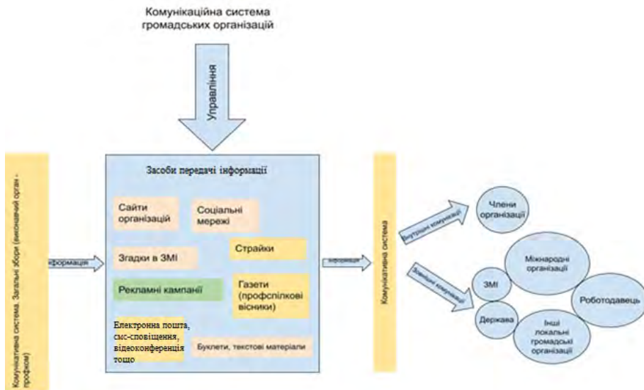
Рисунок 2. Передавання інформації в межах комунікаційної системи профспілкових громадських організацій.

Конструювання результатів, відображених у формі наведених схем, відбувалося шляхом застосування кількох наукових методів. Першим із них є метод емпіричного спостереження. Автор дослідження одержала необхідну інформацію на основі досвіду роботи у профспілкових організаціях. Серед них були «Федерація профспілок України» та Проф-