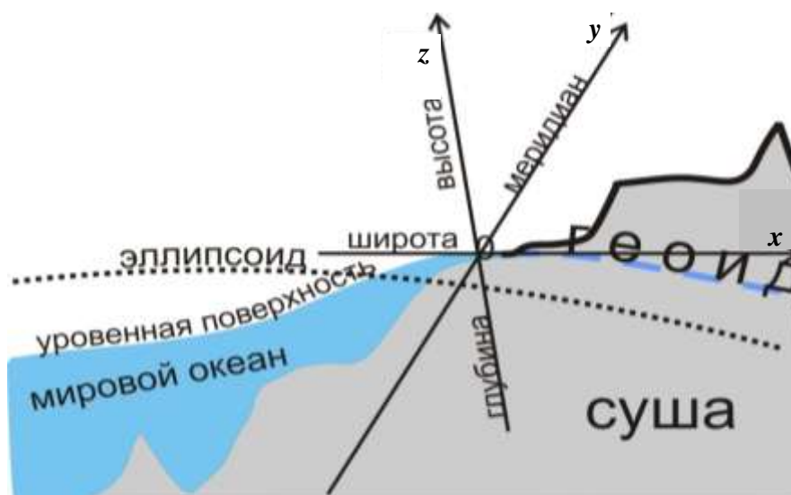
Рис. 2. Окружающее человека пространство в условной системе прямоугольных координат ( x, y, z )

зависимости от числа часовых поясов период полной адаптации организма человека может достигать 18 суток [6].