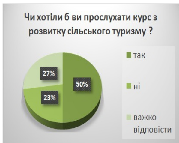
Рис. 2. Результати опитування населення щодо бажання мешканців Райгородської ОТГ отримати додаткові знання з питань розвитку сільського зеленого туризму

Також важливе місце у створенні бренду займає туристичне означування та візуальна ідентифікація.