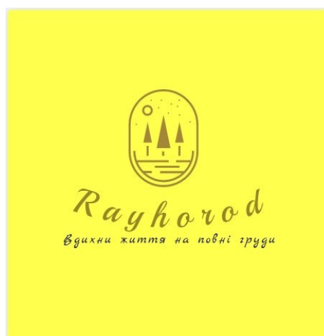
Рис. 3. Приклад логотипу для центру Райгородської ОТГ – с.Райгород (автор Світлана Міченко)