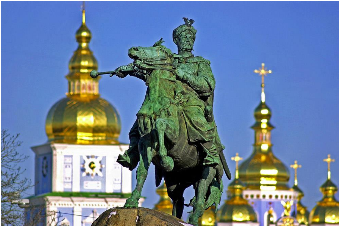
Софіївська площа. Пам'ятник Богданові Хмельницькому в Києві

Тисячі туристів з різних країн відвідують Софіївську площу.