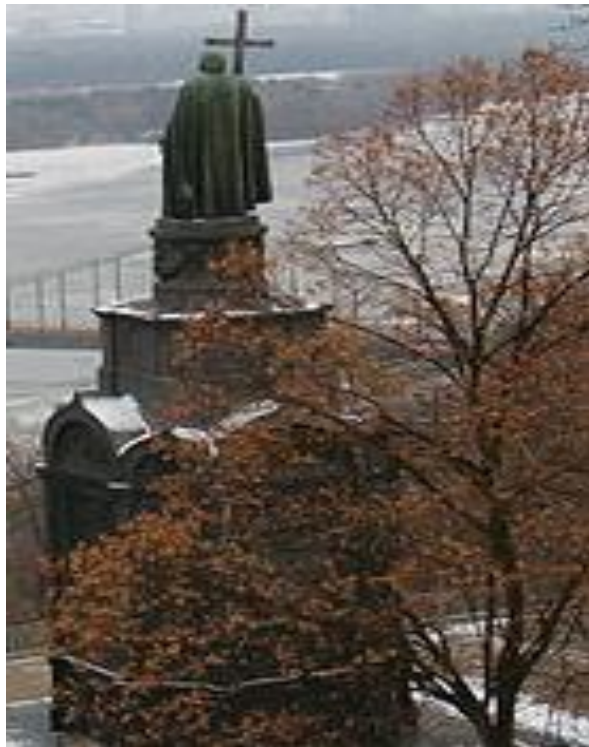
Володимир Великий – великий князь київський (979 – 1015) .

Вулиця Володимирська з'єднує важливі історичні райони Києва. Її названо на честь князя Володимира. Нині вулиця Володимирська є однією з найголовніших та найелітніших вулиць Києва.