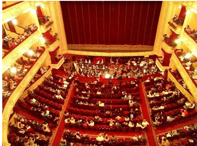
Зала Національної опери України

Національний оперний театр – головний театр нашої столиці та один з найкращих європейських театрів сьогодення.