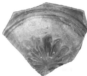
Рис. 9. Денце посудини з кв. 4.