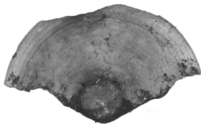
Рис. 20. Керамічна кришечка кв. 68

У районі мосту, у квадраті № 75, на глибині 6,5 м за 7 м від берега знайдена кована уключина з кільцем. Її загальна довжина 25 см, шток – 15 см, на нижній частині є прямокутний отвір 1×0,5 см (Рис. 21).