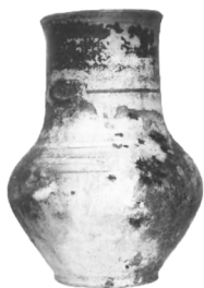
Рис. 18. Глек з кв. 9

У квадраті № 15 на глибині 3 м за 4 м від берега була піднята посудина з відбитою ручкою висотою 20 см, аналогічна глеку, зображеному на Рис. 6, з лінійним та хвилястим орнаментом у верхній частині горщика, діаметр якого 14,5 см, і з лініями у верхній та нижній частині горловини, діаметр якої 9 см. Частина глека покрита шаром сажі (Рис. 18).