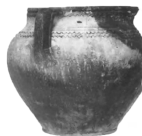
Рис. 11. Глек з кв. 10

У квадраті № 10 на глибині 5 м за 7 м від берега знайдено частину глека з ручкою із зигзагоподібним, глибоко прокресленим орнаментом у верхній частині горщика та дрібними насічками по вінчику. Висота глека 15 см, діаметр – 18 см (Рис. 11). І тут же за 9 м від берега виявлено фрагменти великої тарілки з таким самим орнаментом по краю та всередині. Фрагмент посудини з аналогічним типом орнаменту по вінчику та із зовнішнього боку тарілки (Рис. 12).