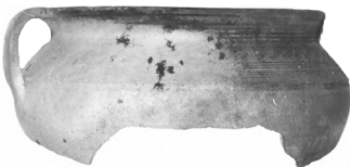
Рис. 14. Посудина, знайдена на межі кв. 10 і 9.

У квадраті № 9 за 4 м від берега на глибині 3,5 м було знайдено ліхтар із жовто-зеленого скла. Ручка і шийка відбиті, скляний виріб краплеподібної форми, на денці знизу є ліycopодібне заглиблення. Висота скла ліхтаря 12 см, діаметр – 8 см (Рис. 15).