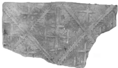
Рис. 19. Кахля з кв. 68

У квадраті № 68 виявлено цегляну кладку та великий фрагмент кахлі із геометричним (хрестоподібні фігури у ромбах) орнаментом довжиною 21,5 см (Рис.19), а також фрагмент керамічної кришки діаметром 18 см (Рис. 20).