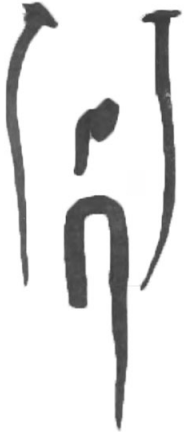
Рис. 23. Скоба та гвіздки з кв. 76

для кріплення (два по краях, один у центрі) (Рис. 24).