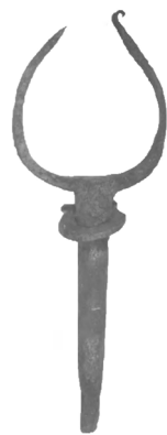
Рис. 21. Уключина з кв. 75

У районі мосту, у квадраті № 75, на глибині 6,5 м за 7 м від берега знайдена кована уключина з кільцем. Її загальна довжина 25 см, шток – 15 см, на нижній частині є прямокутний отвір 1×0,5 см (Рис. 21).