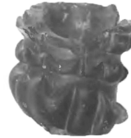
Рис. 16. Фрагмент чарки з кв. 9

Поруч було виявлено фрагмент чарки з сіро-зеленого гутного скла з об'ємним хвилеподібним орнаментом по периметру. Його висота 5,6 см, діаметр – 5,5 см (Рис. 16).