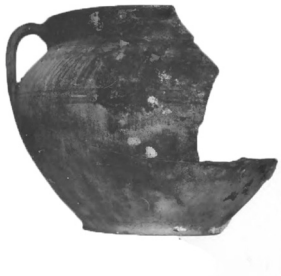
Рис. 13. Горщик, знайдений на межі кв. 10 і 9

На межі квадратів № 10 та № 9 за 5 м від берега на глибині 3,5 м було знайдено частину глечика з ручкою з охристим складним геометричним орнаментом зі слідами жовто-зеленої поливи по вінчику. Висота глека 16 см, діаметр горловини – 18 см, найбільший діаметр – 22 см, діаметр дна горщика – 11 см (Рис. 13), також знайдена верхня частина подібної посудини з ручкою та орнаментом у вигляді декількох тонких ліній, розділених похилими рисочками; діаметр горловини – 18 см, найбільший діаметр – 22 см (Рис. 14).