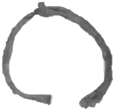
Рис. 23. Підківка від жіночого чобота з кв. 76

для кріплення (два по краях, один у центрі) (Рис. 24).