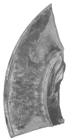
Рис. 8. Тарілка із зеленою поливою з кв. 4.

Тут же знайдено фрагмент посудини із зеленою поливою, яка здулася і частково викришилася (Рис. 8), і фрагмент денця посуду, прикрашений розписом у вигляді квітки (Рис. 9). Крім того, тут же виявлено частину горщика з ручкою, його висота 7,5 см, діаметр горловини – 10 см, діаметр корпусу – 11,5 см (Рис. 10).