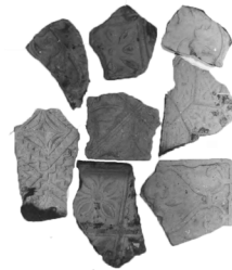
Рис. 17. Фрагменти кахлів з кв. 9

У цьому ж квадраті було знайдено велику кількість фрагментів кахлів з різноманітними геометричним та рослинним орнаментами (Рис. 17).