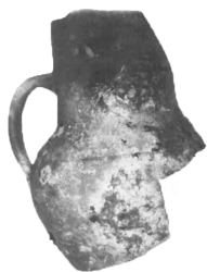
Рис. 6. Гончарний глечик з ручкою з кв. 5

У квадраті № 4 знайдено фрагменти кахлів із зображенням двоголового орла – герба Російської імперії (Рис. 7).