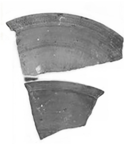
Рис. 12. Фрагмент покриття з кв. 10

На межі квадратів № 10 та № 9 за 5 м від берега на глибині 3,5 м було знайдено частину глечика з ручкою з охристим складним геометричним орнаментом зі слідами жовто-зеленої поливи по вінчику. Висота глека 16 см, діаметр горловини – 18 см, найбільший діаметр – 22 см, діаметр дна горщика – 11 см (Рис. 13), також знайдена верхня частина подібної посудини з ручкою та орнаментом у вигляді декількох тонких ліній, розділених похилими рисочками; діаметр горловини – 18 см, найбільший діаметр – 22 см (Рис. 14).