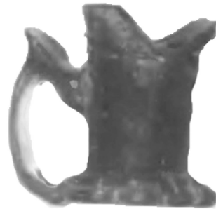
Рис. 5. Скляний свічник з кв. 5

У квадраті № 5 на глибині 6,5 м за 7 м від берега було виявлено зеленого скла свічник з ручкою, на якому зверху є підпора під великий палець. Денце у вигляді семи пелюсток, вінчик надбитий, але зберігся орнамент у вигляді широкої та чотирьох вузьких смужок зі скла. Висота свічника 5 см (Рис. 5).