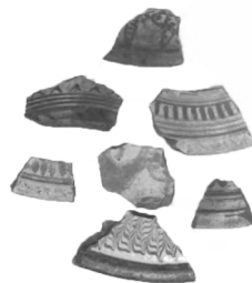
Рис. 22. Фрагменти кераміки з кв. 76, біля мосту і поряд із залишками арби

У квадраті № 76 за 30 м від берега на глибині 6 м виявлено двоколісний віз (арба?). Діаметр колеса 1,8 м, дишлів – 3 м. На жаль, підводні археологи не мали можливостей у форматі розвідки детально обстежити цей цікавий об'єкт. В цьому квадраті було зібрано багато фрагментів кераміки з дуже різноманітним розписом, орнаментом, різнобарвною поливою і без неї (Рис. 22).