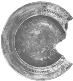
Рис. 3. Поливі'яна тарілка з кв. 2

Тарілка керамічна у внутрішній частині розписана різнобарвною поливою у вигляді плям неправильної форми. По ободу, ширина якого 5 см, йде лінійний орнамент, між яким ряд поперечних рис. Загальний діаметр – 27,5 см. Частина тарілки відколота. Також видно сліди вогню, від впливу якого полива подекуди здулася і відкололася (Рис. 3).