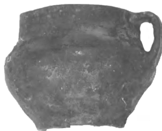
Рис. 10. Горщик з кв. 4, аналогічний посудині, зображеній на рис. 2.

У квадраті № 10 на глибині 5 м за 7 м від берега знайдено частину глека з ручкою із зигзагоподібним, глибоко прокресленим орнаментом у верхній частині горщика та дрібними насічками по вінчику. Висота глека 15 см, діаметр – 18 см (Рис. 11). І тут же за 9 м від берега виявлено фрагменти великої тарілки з таким самим орнаментом по краю та всередині. Фрагмент посудини з аналогічним типом орнаменту по вінчику та із зовнішнього боку тарілки (Рис. 12).