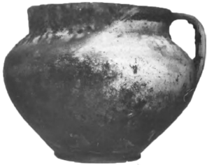
Рис. 2. Глечик з кв. 2

Зокрема, у квадраті № 2 на глибині 6 метрів за 7 метрів від берега було знайдено керамічний посуд з ручкою та лінійним охристим орнаментом у верхній частині корпусу. Більшість глечика покрита шаром сажі. Висота посудини 15,5 см, діаметр горщика у найширшій частині 20 см, а горловини – 14 см, висота вінчика – 3 см (Рис. 2).