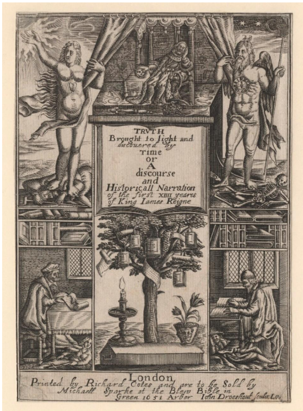
Рис. 1 King James I of England and VI of Scotland with Truth and Time, Memory and History by John Droeshout line engraving, 1603, published 1651. National Portrait Gallery, London.