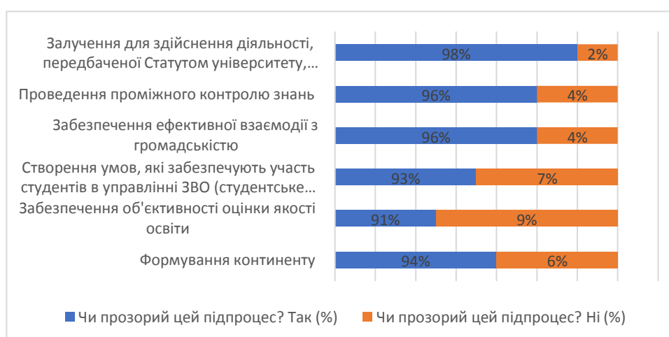
Рис. 3.1. Прозорість взаємодії зі студентами, %

Проілюструємо узагальнені у таблиці 3.1. дані на рисунку 3.1.