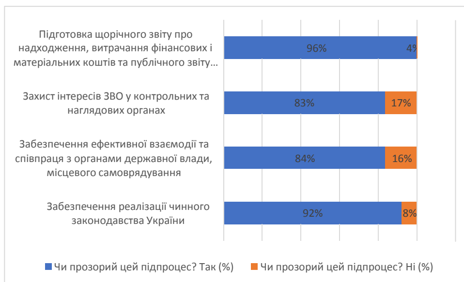
Рис. 3.4. Прозорість процесів у сфері дотримання законодавства та взаємодії з органами публічної влади, %

Проілюструємо узагальнені у таблиці 3.4. дані на рисунку 3.4.