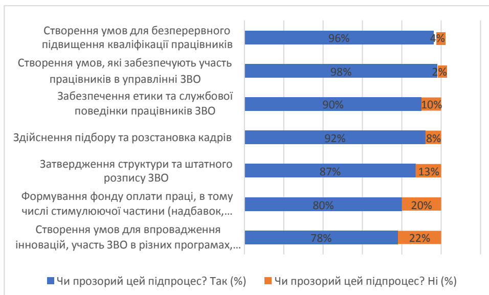
Рис. 3.2. Прозорість взаємодії з трудовим колективом університету, % Складено автором

Як свідчать дані таблиці 3.2. та рис. 3.2., найменш прозорими, а отже, найбільш ризикогенними чинниками за аналізованим бізнес-процесом «Прозорість взаємодії з трудовим колективом університету» у ДонНУ є «Створення умов для впровадження інновацій, участь ЗВО в різних програмах, проектах та грантах» (22%), «Формування фонду оплати праці, в тому числі стимулюючої частини (надбавок, доплат)» (20%).