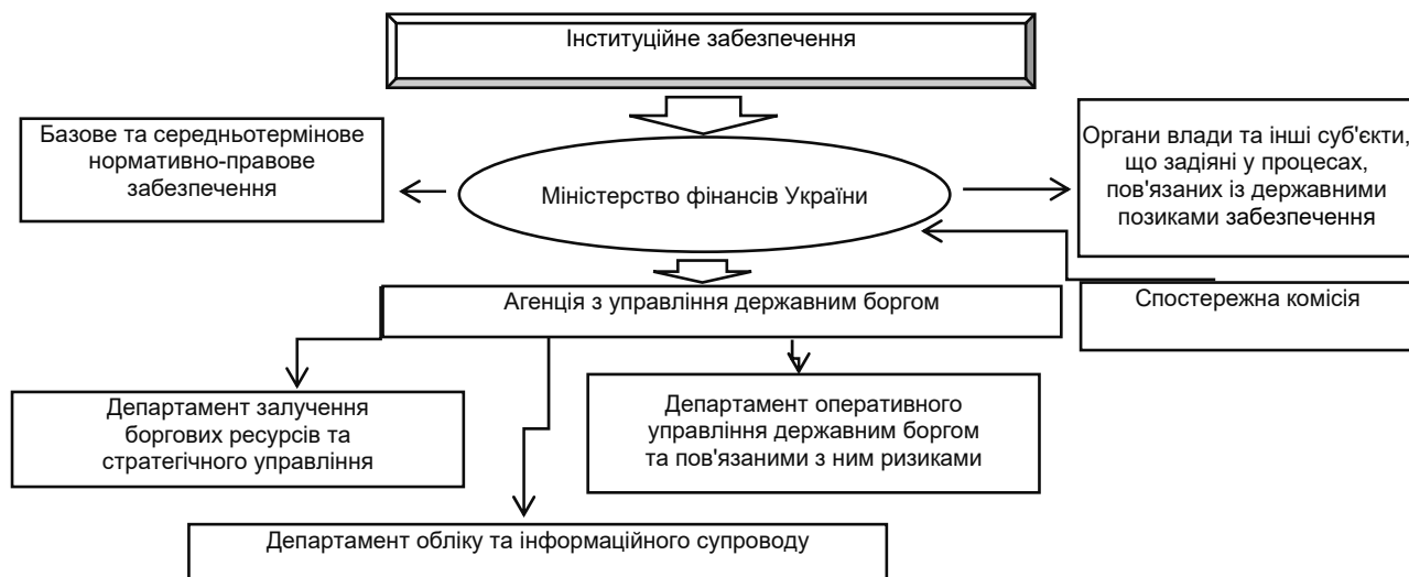
Рис. 2. Модель інституційного забезпечення в Україні

З огляду на відсутність в Україні позитивного емпіричного досвіду управління державним боргом, неврегульованість процедур його контролю та відсутність системи моніторингу пропонуємо впровадження трикомпонентної моделі інституційного забезпечення цього процесу. Вона передбачає виділення відносно відокремленої інституційної структури – агенції або комітету, підпорядкованої Міністерству фінансів України, чиї функції будуть зосереджені навколо виконання трьох головних завдань у системі управління державними запозиченнями, а саме залучення боргових ресурсів та прийняття стратегічних рішень щодо здійснення внутрішніх і зовнішніх позик, надання державних гарантій на основі базового нормативно-правового забезпечення, оперативне управління державним боргом і пов'язаними з ними ризиками та забезпечення обліку та інформаційного супроводу управління державним боргом. Основні складові частини моделі інституційного забезпечення в Україні розглянемо на рис. 2.