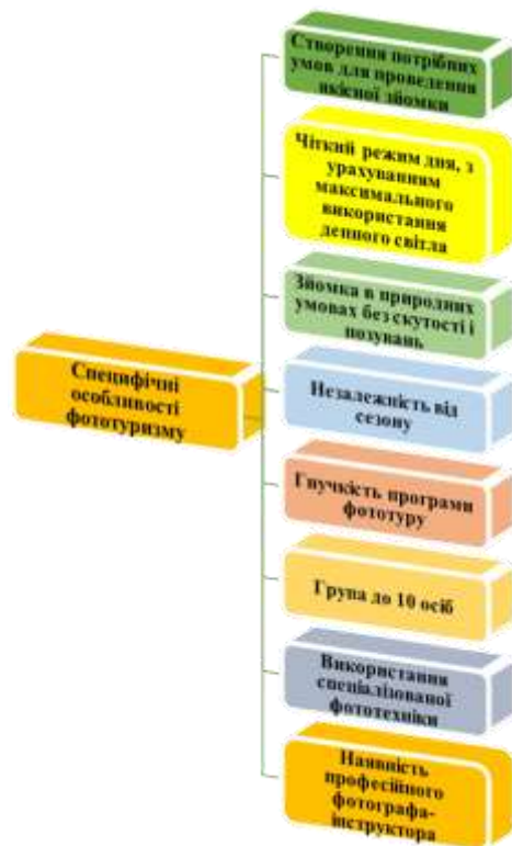
Рис.1 - Специфічні особливості фототуризму