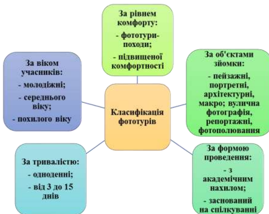
Рис.2 - Класифікація фототурів

Закордоном фототуризм є одним з популярних видів відпочинку. Приблизно 30 років тому він почав свій розвиток у Європі, яка найбільше підходить для тематичних зйомок. Так, наприклад, для Скандинавії характерний піший туризм з відвідуванням національних парків, таких як Сарек, Рондане, Абіску, Юре, Тіведен тощо; для Іспанії характерний екскурсійний туризм і відвідування таких об'єктів, як Національний парк Гауді, музей Сальвадора Далі; Греція відкрита для відвідування всесвітньовідомих визначних місць, таких як Акрополь, Метеори, Олімп, які є чудовим об'єктом для поєднання архітектурної та вуличної фотографії [6]. Фототури в Ізраїль, Марокко, Туніс,