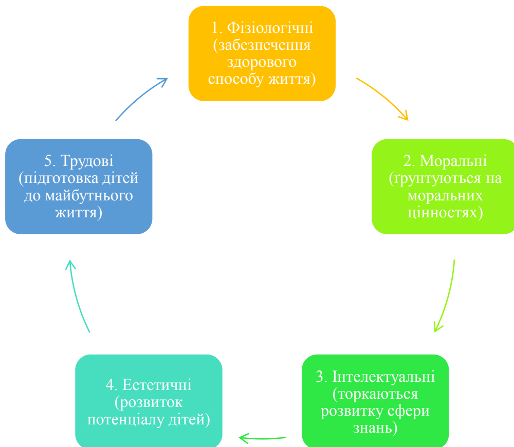
Рис. 1.1. Компоненти сімейного виховання

У клінічно орієнтованій літературі зустрічається таке визначення стилю виховання – це сукупність приватних понять, принципів, установок, ціннісних орієнтирів, що створюють умови у розвиток дитини та її підготовки до життя [29, с. 35]. Компоненти сімейного виховання наведено на рисунку 1.1.