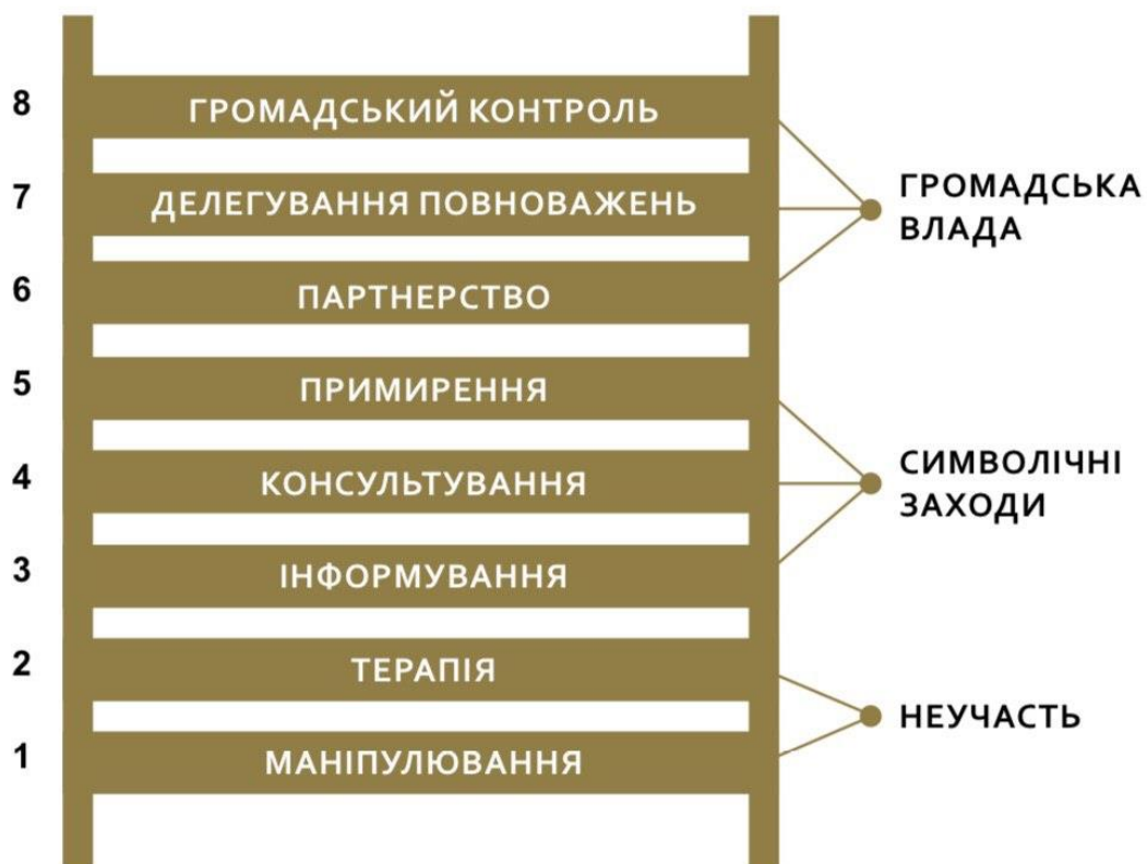
Рис.1.1: драбина участі Арштайн

сильний та вирішальний голос у вирішенні питань. Варто зазначити, що незважаючи на те, що дослідниця описує кожні сходинки з точки зору становища бідних мешканців у системі соціальної допомоги США, розроблена нею концепція виявилась настільки універсальною, що й досі усі типології базуються на її основі - шляху від маніпуляції до залучення громадян до процесу прийняття рішень [9].