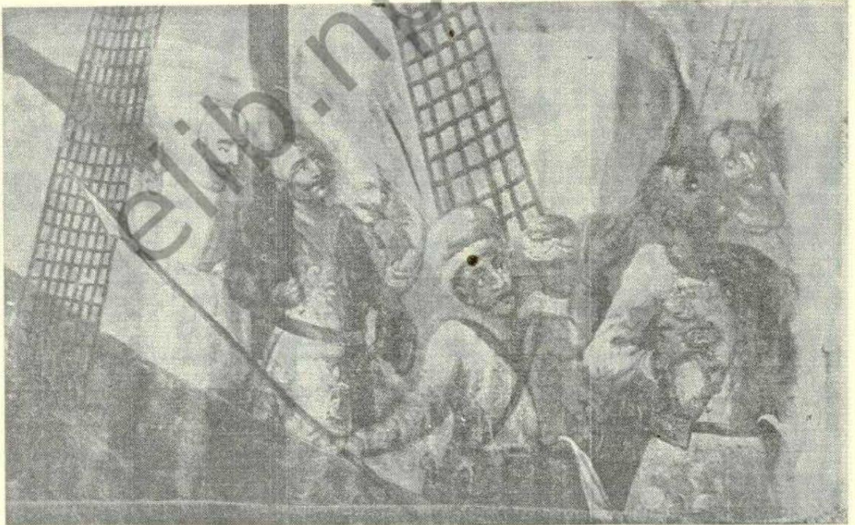
Мал. 3 (Р. 18): деталь