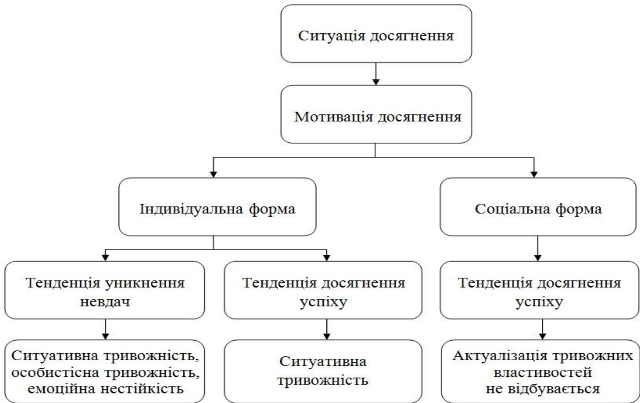
Рис. 2. Схема процесу актуалізації особистісних властивостей тривожного спектру в ситуації досягнення

З високим рівнем особистісної тривожності пов'язані такі її складові: емоційний дискомфорт ( r = 0,793^{**} ), астеничний ( r = 0,693^{**} ) та фобічний ( r = 0,605^{**} ) компоненти, оцінка перспективи ( r = 0,743^{**} ). Емоційний дискомфорт у складі особистісної тривожності корелює з емоційною нестійкістю ( r = 0,526^{**} ) та допитливістю у складі креативності ( r = 0,661^{**} ). Астеничний компонент у складі особистісної тривожності позитивно корелює з потребою у безпеці ( r = 0,158^* ) та негативно – з фактором «Q1 – консерватизм-радикалізм» ( r = -0,451^{**} ). Фобічний компонент у складі особистісної тривожності пов'язаний з емоційною нестійкістю ( r = 0,494^{**} ) та інфантильним типом особистості ( r = 0,319^{**} ). Потреба у соціальному захисті як складова особистісної тривожності пов'язана з мотивацією досягнення ( r = -0,314^{**} ) та потребою у саморозвитку ( r = 0,322^* ).