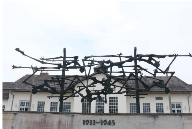
Рис. 2.2 Меморіальний комплекс концтабору Дахау [48]

«Шлях в'язнів», також оновлюються тимчасові виставки, що присвячені різним темам і є можливість відвідати віртуальний тур комплексом. [48]