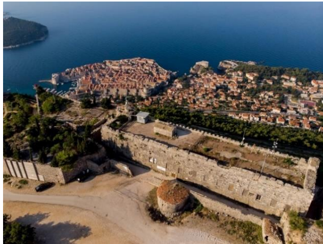
Рис. 2.5 Музей Вітчизняної війни (Дубровник) [52]

Одним із лідерів за розвитком воєнного туризму є США, на території країни є велика кількість об'єктів військово-історичної спадщини, яка охоплює період Громадянської війни в США 1861-1865 рр., а також присвячені меморіали, музеї участі армії США у Першій та Другій світовій війні, В'єтнамській війні. Воєнний туризм є популярним не тільки серед американців, але й велика кількість туристів із усього світу відвідують, цікавляться та досліджують саме військово-історичну складову країни. [42]