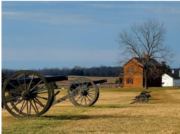
Рис. 2.6 Національний парк поля битви Манассас (США) [46]

Національний меморіал Перл-Гарбор (Гаваї) – 7 грудня 1941 року Японія скинула бомби на Перл-Гарбор, у результаті чого загинула велика кількість не тільки військових, але і мирних людей, також був потоплений лінкор «Арізона». Зараз це місце пам'яті, у туристів є можливість дослідити та дізнатися більше про одну з найважливіших подій в американській історії. Атака на військові аеродроми та кораблі воєнно морських сил розпочала Тихоокеанський театр воєнних дій, як складову Другої світової війни. У даний час, на місці затонулого лінкора «Арізона» створений меморіал, було відкрито музей, організовуються комплексні екскурсії територією бухти з можливістю відвідати лінкор «Міссурі». [42]