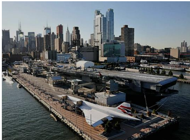
Рис. 2.8 Музей «Interpid» (США) [45]

брав участь у Корейській та В'єтнамській війнах, був задіяний у блокаді Куби під час Карибської кризи із СРСР. Після своєї військової історії авіаносець був використаний у космічних програмах NASA «Mercury» і «Gemini». Після списання у 1974 р. авіаносець був викуплений і пришвартований у Нью-Йорку, відкриття самого музею відбулося 1982 р., а з 1986 р. музей визнано історичною пам'яткою США. Експозиція музею включає в себе десятки військових літаків, винищувачів у тому числі легендарний літак-розвідник «Blackbird» та винищувач «Tiger», колекція музею може похизуватися єдиним підводним човном «Glowler» з ядерною зброєю, який відкритий для публіки. Доповнює цю експозицію перший космічний шатл «Enterprise». Згідно офіційних даних музею, щороку експозицію відвідує понад мільйон туристів. [45]