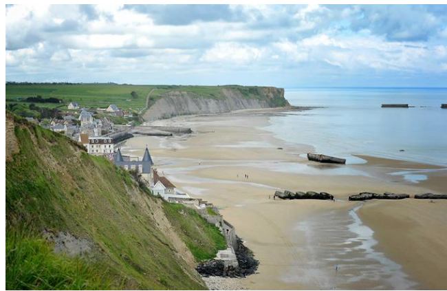
Рис. 2.1. Узбережжя Нормандії [40]

Меморіальний комплекс концтабору Дахау (Німеччина) – один із перших концентраційних таборів поблизу однойменного міста, який діяв у період з 22 березня 1933 року по 29 квітня 1945 року. У подальшому цей табір слугував моделлю для всіх наступних концтаборів і «школою насильства» для есесівців. Впродовж 12 років існування було ув'язнено понад 200,000 осіб з усієї Європи, за офіційними даними 41,500 осіб було вбито. Меморіальний комплекс був створений у 1965 році за ініціативою колишніх в'язнів, які об'єдналися в Міжнародний комітет Дахау (Comité International de Dachau). Головна експозиція комплексу була створена в період з 1996 по 2003 роки про історію концтабору, яка слідує лейтмотиву