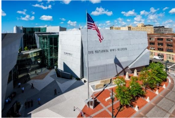
Рис.2.9 Національний музей Другої світової війни (Новий Орлеан) [56]

Європейський та Тихоокеанський театр бойових дій та павільйон визволення. Окрім цього, доступні віртуальні екскурсії, вебінари, а також навчальні програми. [56]