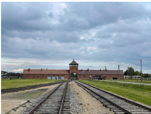
Рис.2.4 Державний музей Аушвіц-Біркенау (Польща) [37]

Музей Вітчизняної війни (Хорватія) – Експозиція музею знаходиться у форті Імперіал, який французи побудували на пагорбі Срдж у 1812 і присвятили Наполеону І. Протягом Вітчизняної війни 1991-1995 рр. форт був на передовій оборони міста Дубровник і служив командним пунктом 163-ї Дубровницької бригади хорватської армії. Він став символом героїчної оборони міста. Виставка була відкрита у 2008 році, як початковий етап проекту майбутньої постійної експозиції Музею Вітчизняної війни в Дубровнику. На теперішній момент виставка складається із чотирьох блоків : «Падіння Рагузанської республіки та історія форту Імперіал»; «Сербсько-чорногорська агресія 1991 року»; «Дні перемоги – зняття блокади Дубровника та звільнення південної Хорватії»; та «Людські жертви та руйнування цивільних будівель і пам'яток культури в районі Дубровника». У експозиції представлені оригінальні документи, художні і документальні фотографії з епохи Вітчизняної війни, а також зброя, міни, вибухівка, предмети побуту, прапори військових підрозділів, а також автентичні фото- та відеоматеріали. [52]