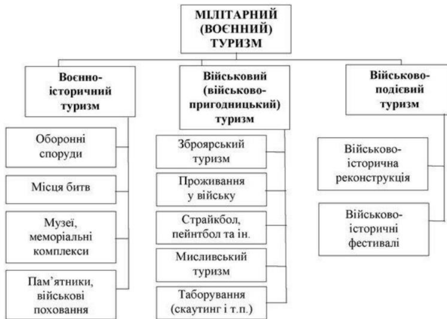
Рис. 1.2 Класифікація (мілітарного воєнного туризму) [13]

(пов'язаний з бойовими діями) туризм. Як і В. Кушнар'ов та О. Поліщук вони розділяють мілітарний (воєнний) туризм на три групи, а саме: воєнно-історичний, військовий (військово-пригодницький) та військово-подієвий. [13]