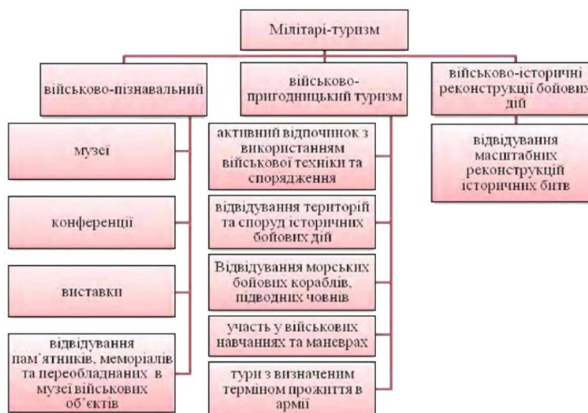
Рис. 1.1 Класифікація мілітарі-туризму як спеціалізованого виду туризму [16]

Також потрібно згадати про те, що одним із підвидів військового туризму є вид, що останнім часом набуває неабиякої популярності, і це – нелегальні тури, які проводяться безпосередньо у зонах військових конфліктів. Такі поїздки характеризуються високою вартістю, оскільки гарантування безпеки клієнтам це один із найголовніших аспектів організації таких подорожей для туристичної компанії, через великий рівень небезпеки для мандрівника. [18]