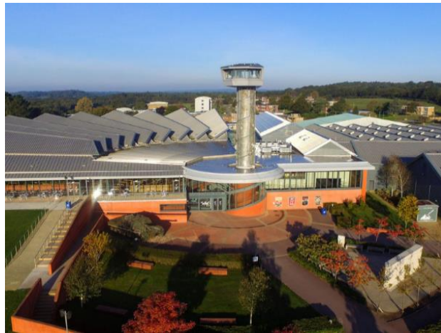
Рис.2.3 Танковий музей (Бовінгтон) [57]

Варто зазначити, що з початком повномасштабного вторгнення росії в Україну співробітники музею разом із британською компанією «William Cook Defense Ltd» залучали музейні радянські танки для реконструкції та виготовлення гусениць для відправки до України. [57]