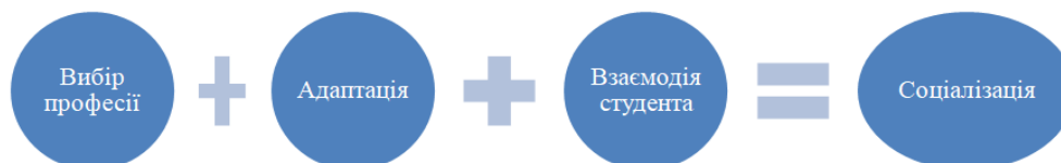
Рис. 1. Шляхи соціалізації іноземних студентів

Слід зазначити, що професійна соціалізація іноземних студентів у закладах вищої освіти відбувається в кілька етапів (рис.1).