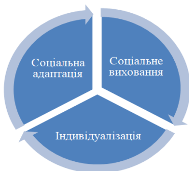
Рис. 2. Соціалізація іноземного студента

Соціалізація іноземних студентів можлива не лише через заклад вищої освіти, а й шляхом залучення громадськості. Залучення громадськості потрібне не лише для оцінки потреби громади або суспільства, а й для узгодження стратегії розв'язання проблем. Наприклад,