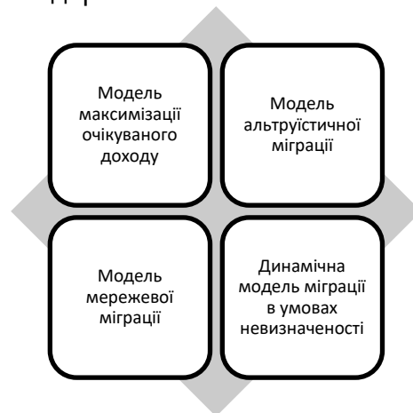
Рис. 2. Класифікація моделей міграції НЕТМ

мігрантів. Такий підхід дозволяє переосмислити міграцію з позиції взаємопов'язаних економічних і соціальних факторів, враховуючи колективний характер рішень, що приймаються домогосподарствами. Розглянемо чотири моделі НЕТМ.