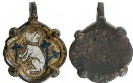
Іл. 4. Жетон-підвіска (Королівство Наварра). XV ст. Metropolitan Museum of Art (м. Нью-Йорк, США). Розмір – 31x41 мм. Метал – мідь (в емалях з позолотою).