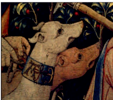
Іл. 7. Пес з монограмою власника на нашійнику. Фрагмент гобелена «Єдиноріг перетинає потік». Близько 1495–1505 рр. Metropolitan Museum of Art (м. Нью-Йорк, США).