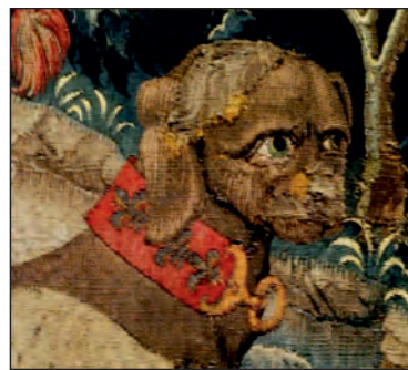
Іл. 6. Пес з королівськими ліліями на нашійнику. Фрагмент гобелена «Полювання на Єдинорога». Близько 1495–1505 рр. Metropolitan Museum of Art (м. Нью-Йорк, США).