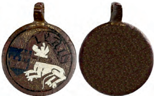
Іл. 3. Жетон-підвіска. LERIN. Графство Лерін (Королівство Наварра). XV ст. Metropolitan Museum of Art (м. Нью-Йорк, США). Розмір – 38x51 мм. Метал – мідь (в емалях з позолотою).