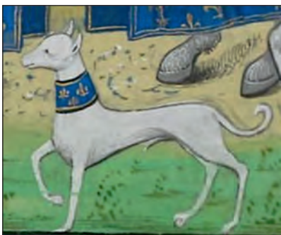
Іл. 5. Пес з королівськими ліліями на нашійнику. Автор – Рено де Монтобан. Близько 1495 р. Кахля з палацу Ізабелли д'Есте в м. Мантуя (Італія).