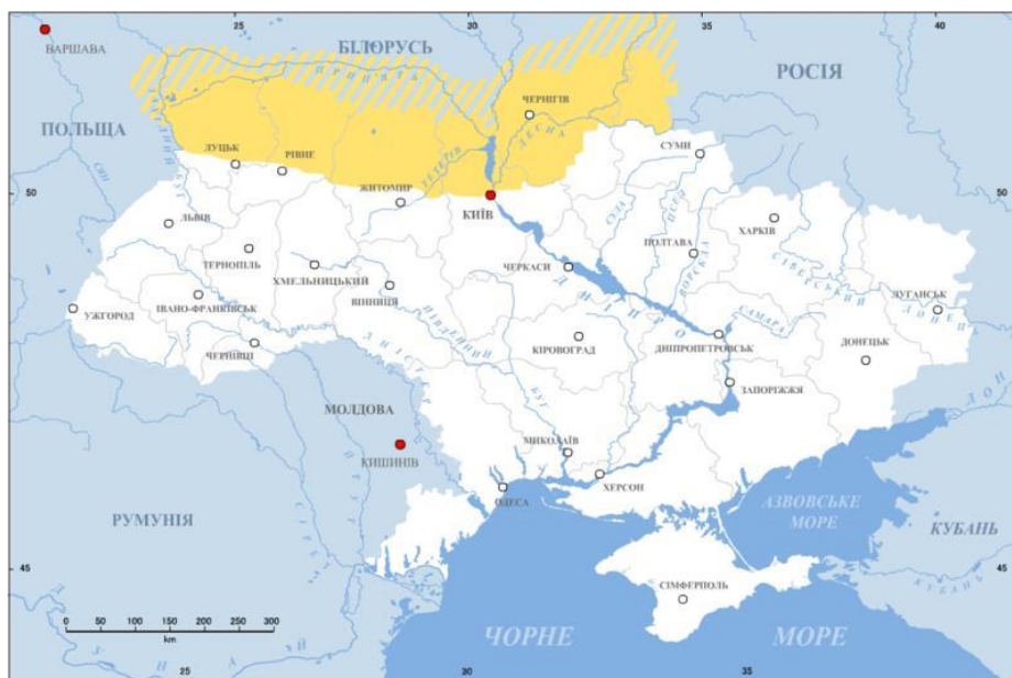
Рис. 2.1. - Українське Полісся [2,с.112]

Якщо проводити аналіз території, яка входить до Українського Полісся, то в межах адміністративного поділу до нього входять (Рис. 2.1.) [1]: Волинська, Рівненська області (не враховуючи їх південних частин), Житомирську область (без врахування південної її частини), а також - північну частину Київської та Хмельницької областей. Інколи (помилково), до території Українського Полісся також відносять і Чернігівську область, хоча насправді вона має інші історичні та географічні характеристики та виноситься в окрему групу - Чернігівське Полісся. Також досить часто можна зустрічати і твердження, що до території Українського Полісся відноситься вся зона лісової смуги, розташованої в межах кордонів України.