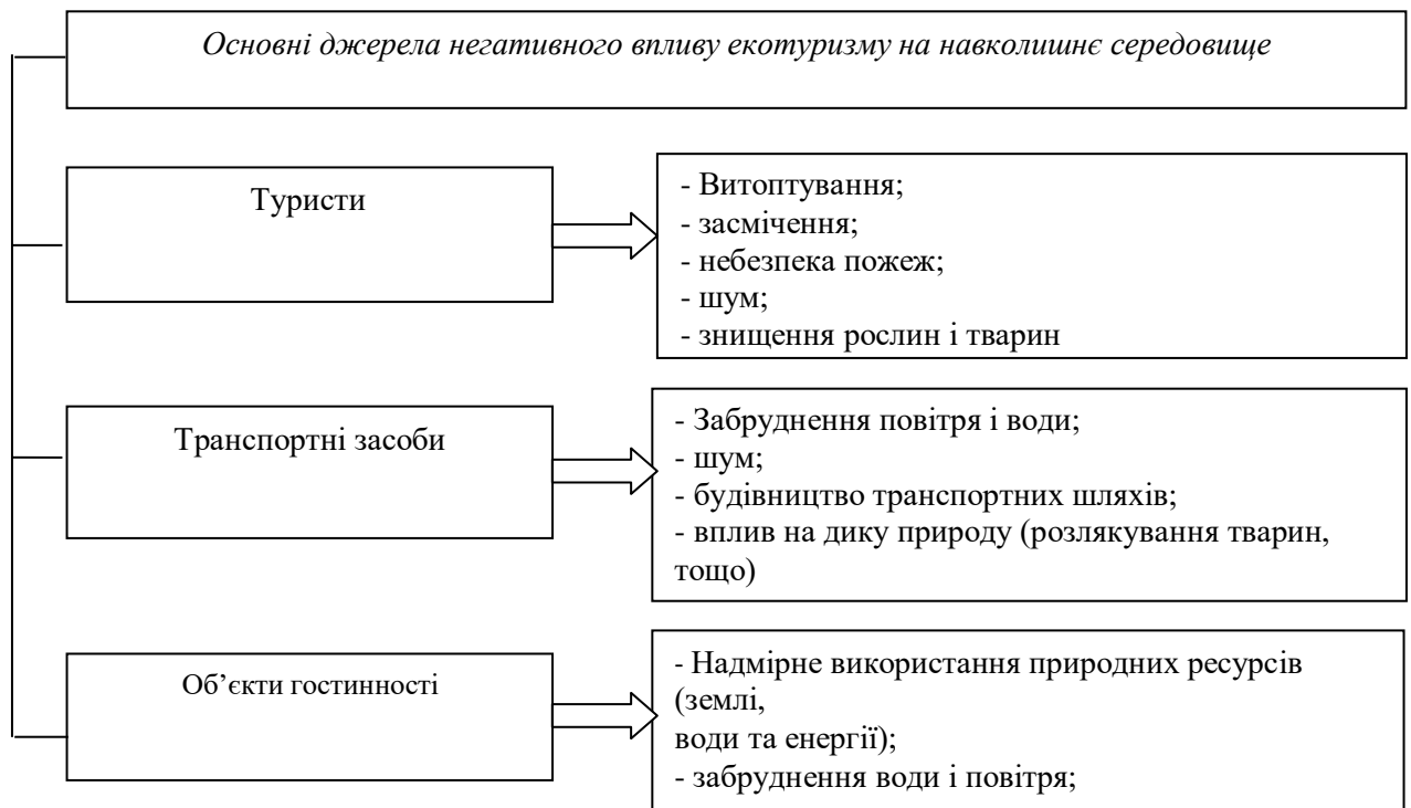
Рис.1.1.Основні джерела негативного впливу екотуризму на навколишнє середовище [Складено автором]

Основними наслідками впливу туристів є витоптування ґрунту та рослинності на туристичних маршрутах, засмічення, збільшення ймовірності пожеж, знищення певних видів флори та фауни, а також створення факторів занепокоєння. Ці зміни є більшими, коли певні території приваблюють велику кількість туристів, наприклад, узбережжя, популярні гірські маршрути та найбільш відвідувані гірські вершини, приміські рекреаційні зони та поблизу привабливих туристичних об'єктів (печер, водоспадів, скельних утворень тощо)[27,с.35].