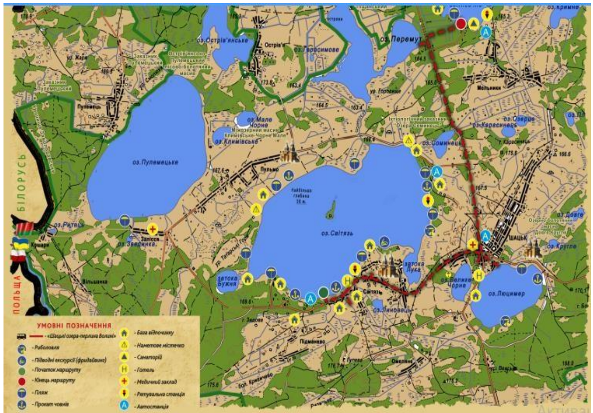
Рис.3.1. Картосхема маршруту екотуру «Полісся» розроблено автором за Картою туристичних маршрутів Шацький національний природний парк

Маршрут екскурсійної програми становить прогулянку територією Національного природного парку «Шацький» (рис.3.1).