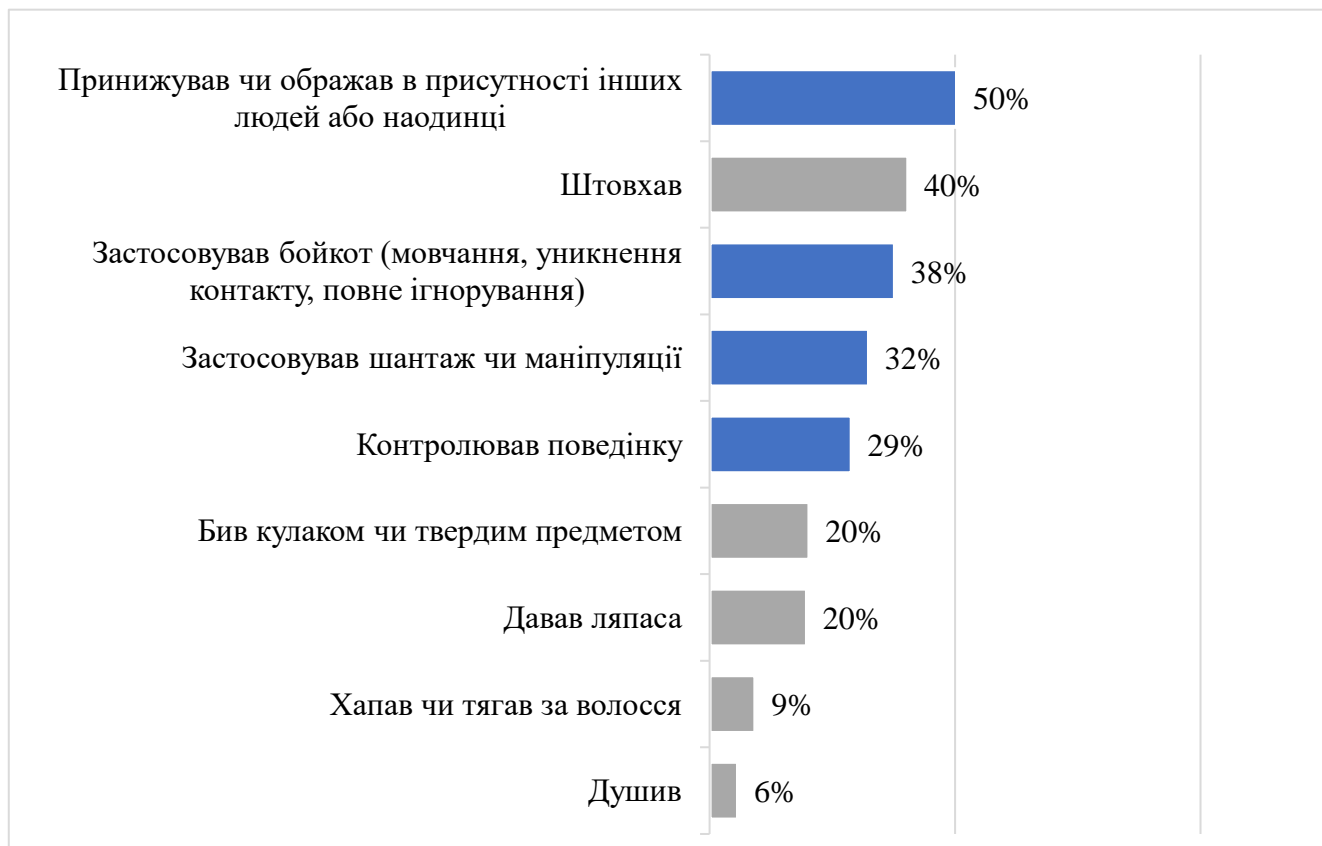
Рисунок 3.2. Розподіл форм насильства щодо жінок (досвід матері)

Застосування насилля нинішнім або попереднім партнером по відношенню до жінок, з якими пов'язують сімейні зв'язки: виключивши ситуації необізнаності, найбільш поширеними відзначено усі форми психологічного насилля. У той же час, варто відзначити, що, у порівнянні із власним досвідом, ситуації насилля по відношенню до жінок, з якими пов'язують сімейні зв'язки, є значно поширенішими. Зокрема, найбільшу різницю відзначено у таких формах насилля як: