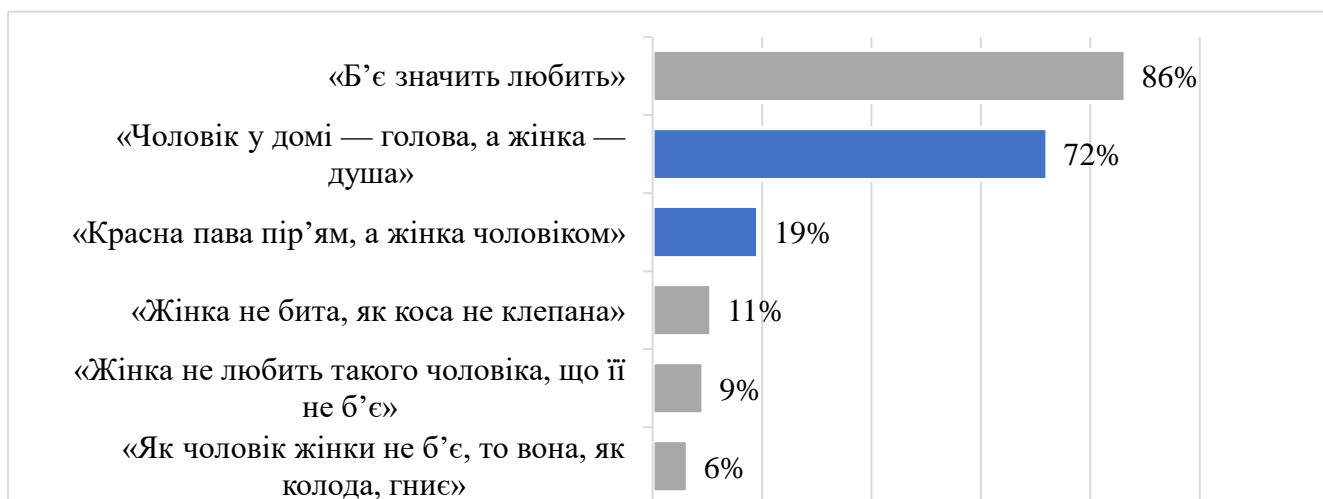
Рисунок 3.6. Розподіл народних афоризмів, котрі жінки відзначили, що зустрічають у своєму повсякденному дискурсі

Чи зустрічали респондентки афоризми у повсякденному дискурсі: серед афоризмів найчастіше жінки у своєму повсякденному дискурсі зустрічали такі як «Б'є значить любить» та «Чоловік у домі – голова, а жінка – душа» (86% та 72%, відповідно).