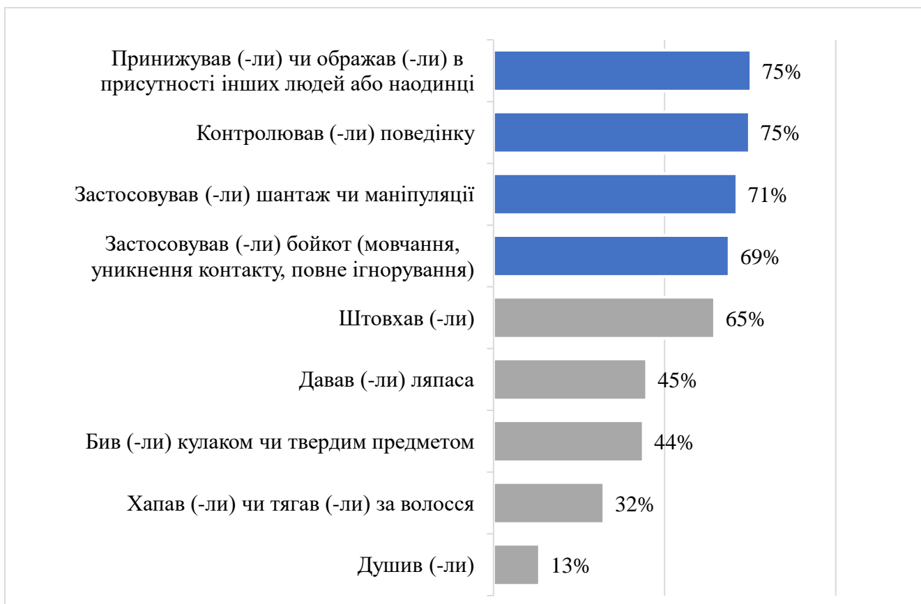
Рисунок 3.3. Розподіл форм насильства щодо жінок (досвід жінок, з якими пов'язують сімейні зв'язки)

Застосування насилля нинішнім або попереднім партнером по відношенню до подруг/ колежанок: у порівнянні із власним досвідом, ситуації насилля по відношенню до подруг та колежанок також є значно поширенішими. Утім, найбільшу різницю відзначено у таких формах насилля як: