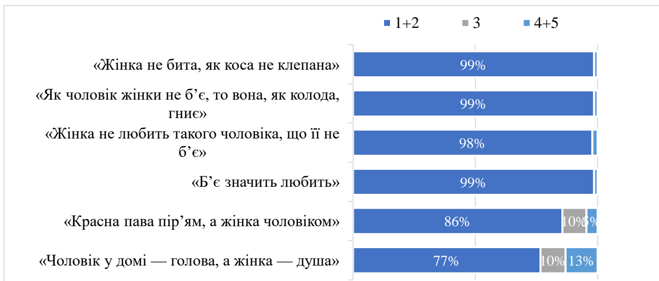
Рисунок 3.5. Розподіл оцінок народних афоризмів (за школою від 1 до 5, де 5- ви абсолютно згодні з моделлю поведінки у стосунках, котру вони транслюють, а 1 – абсолютно не згодні))

Чи зустрічали респондентки афоризми у повсякденному дискурсі: серед афоризмів найчастіше жінки у своєму повсякденному дискурсі зустрічали такі як «Б'є значить любить» та «Чоловік у домі – голова, а жінка – душа» (86% та 72%, відповідно).