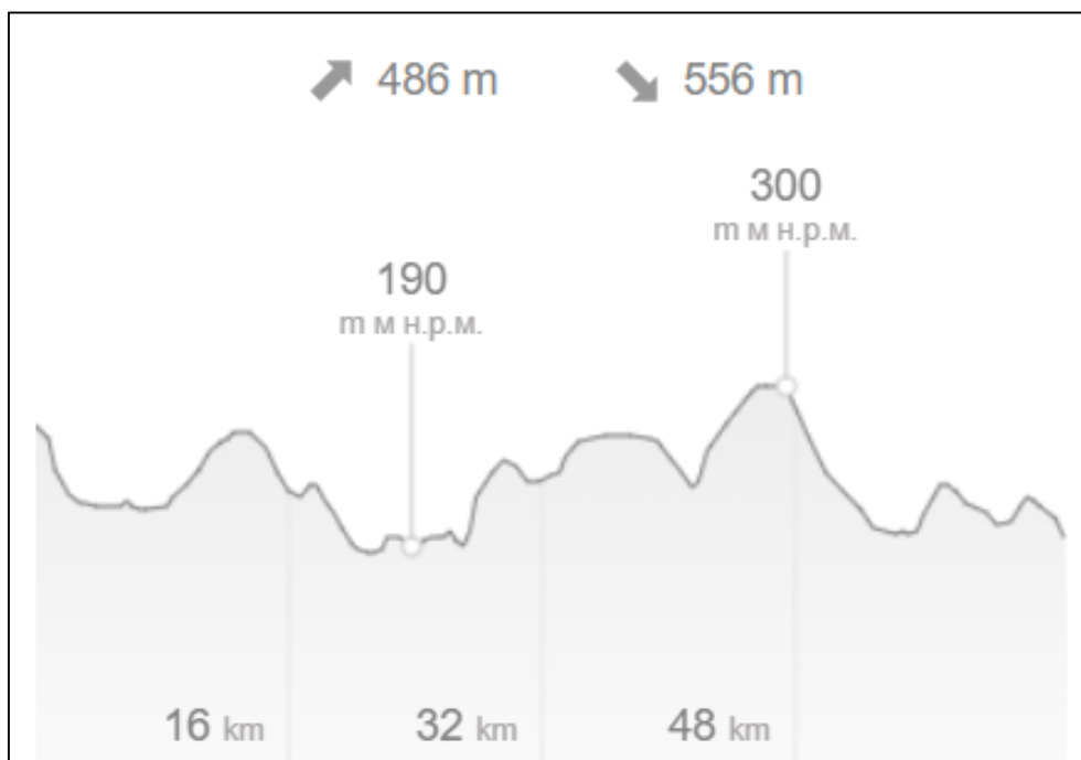
Рис. 1. Профіль висот Вінницького району

Результати та їх аналіз. Для організації ступеневого походу обрано територію Вінницького району Вінницької області. Фізико-географічні особливості Вінницького району пов'язані з його розташуванням на Західному Поділлі. В рельєфі даній місцевості відповідає Придніпровська височина. Поверхня Вінницького району – підвищене плато, яке понижується в напрямку з північного заходу до південного сходу.