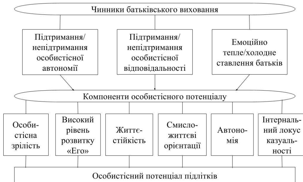
Рис. 1. Концептуальна модель впливу батьківського виховання на особистісний потенціал підлітків

На основі теоретичного аналізу компонентів особистісного потенціалу і особливостей батьківського виховання розроблено концептуальну модель впливу батьківського виховання на особистісний потенціал підлітків (рис. 1).