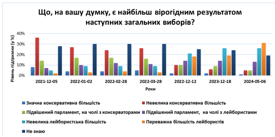
Рис. 3.1. Динаміка змін рівня підтримки консервативної та лейбористської партій [16]

британцям загрожувала ледь не кримінальна відповідальність за порушення умов карантину.