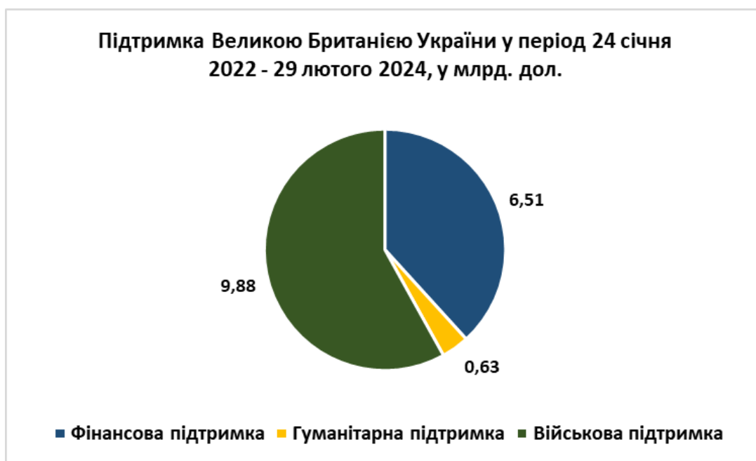
Рис. 3.4. Візуалізація британської допомоги Україні [23]

не такі великі як допомога зі сторони США та Німеччини, але варто враховувати те, що Британія сама страждає від недофінансування власних збройних сил, через що змушена до 2030 року скоротити чисельність власних військ до 73 тис. осіб (до 2022 чисельність ЗС Сполученого Королівства складала 79,3 тис. осіб) [22].