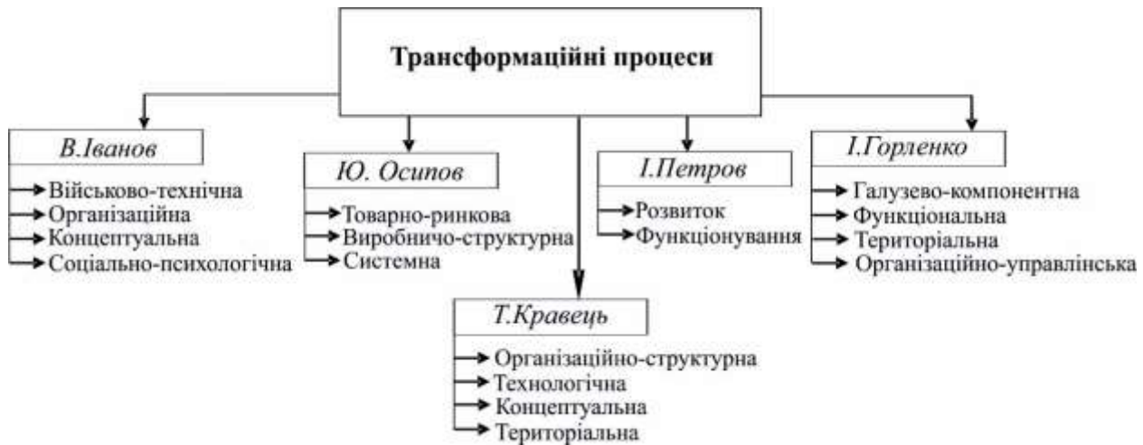
Рис 1. Підходи до класифікації трансформаційних процесів

Відсутність комплексного підходу: Деякі класифікації можуть фокусуватися на одному аспекті трансформацій, не враховуючи комплексність та взаємодію різних факторів. Вони можуть недостатньо уваги приділяти взаємозв'язкам між організаційними, технологічними, концептуальними та іншими аспектами змін.