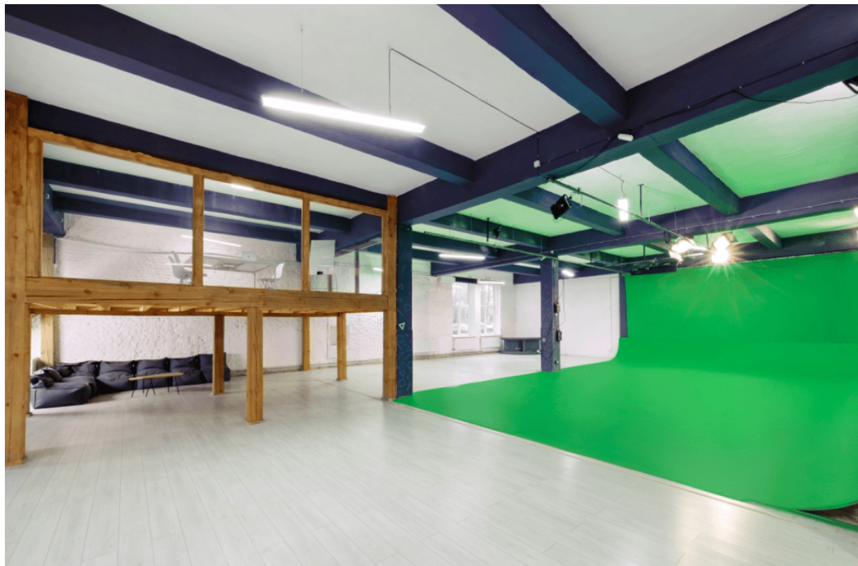
Зал «Room 101»