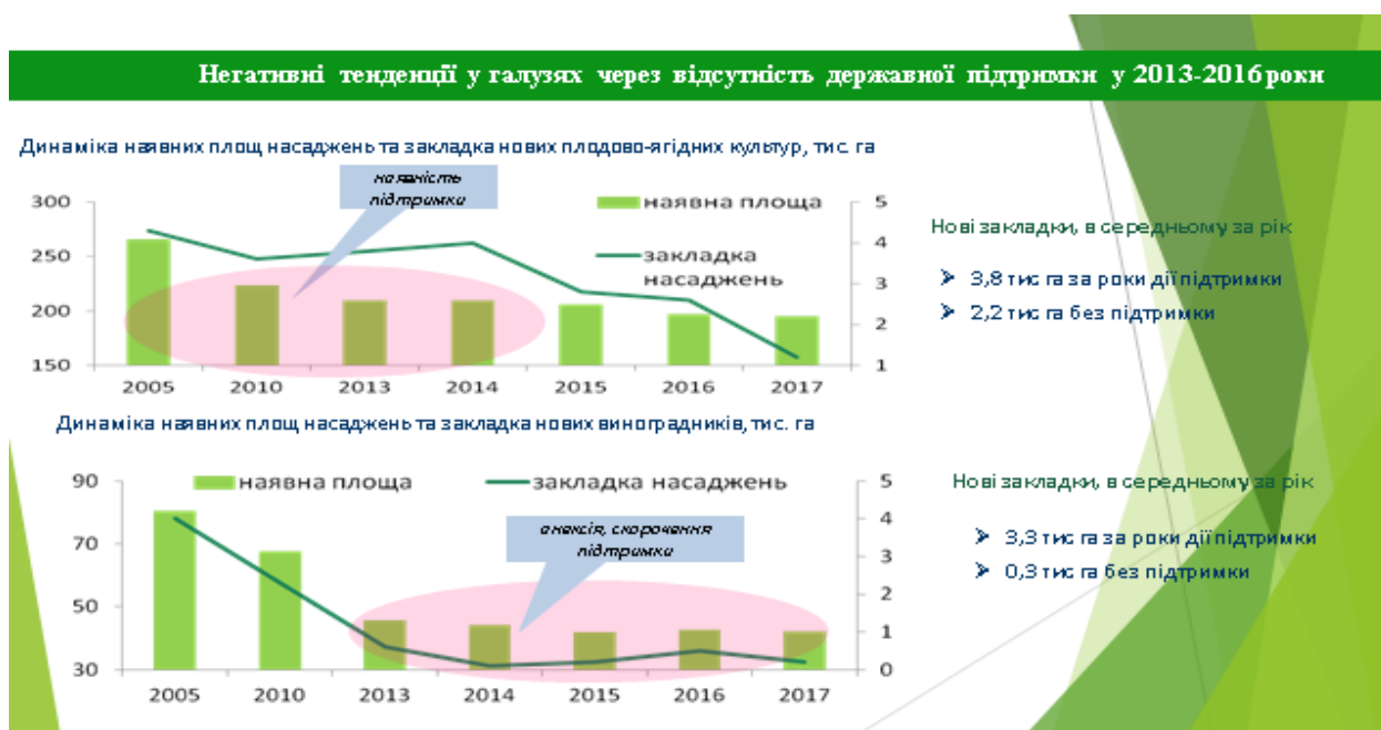
Рис. 9. Динаміка закладень багаторічних насаджень з 2005 по 2017 р.р.

Наукове забезпечення діяльності учасників ринку садівництва, а також вивчення сортів, біології, екології плодкових рослин здійснюється науковими установами, що входять до складу Національної Аграрної Академії Наук України, далі - НААН.