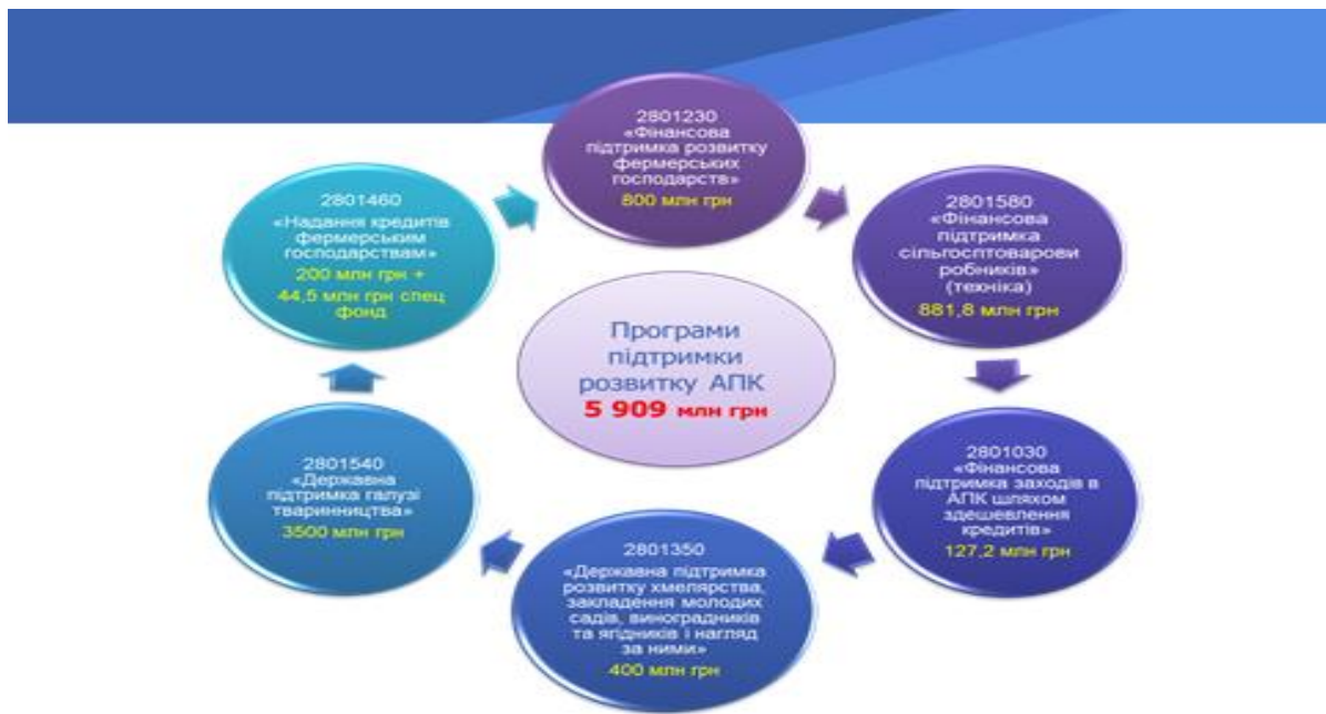
Рис.2. Програми державної підтримки у сільському господарстві у 2019 році