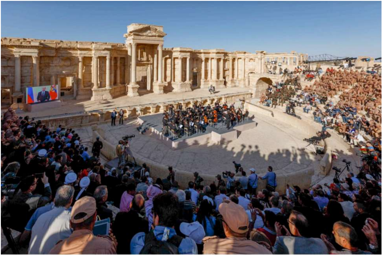
Додаток 3. Російський оркестр і промова Путіна в захопленій росіянами Пальмірі. 6 травня 2016 р.