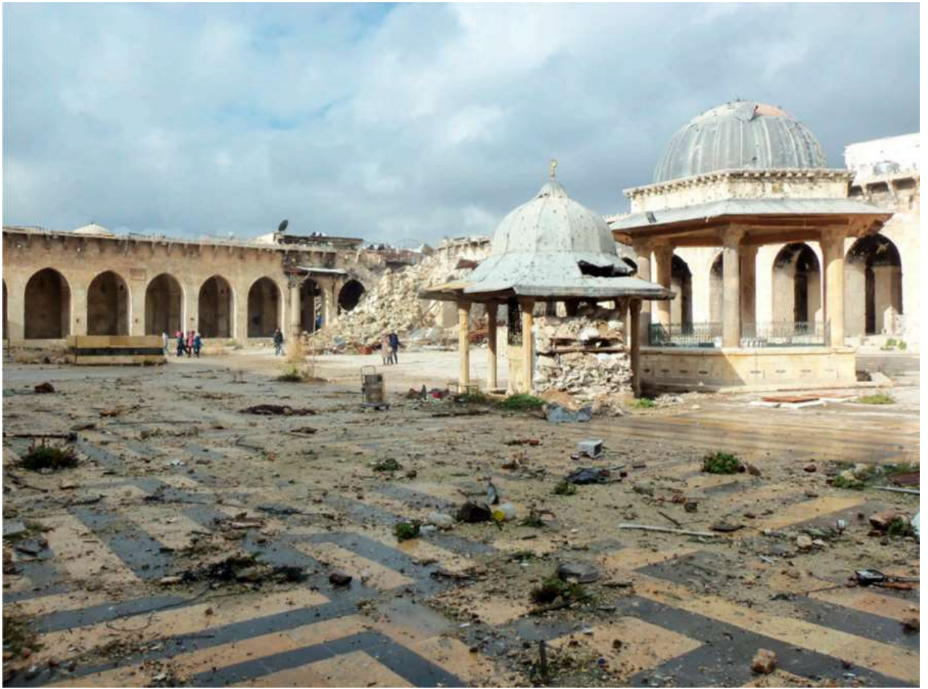
Додаток 4. Велика мечеть Омейядів в Алеппо і мінарет після руйнування. Фото: Луай Дакелем (2017).