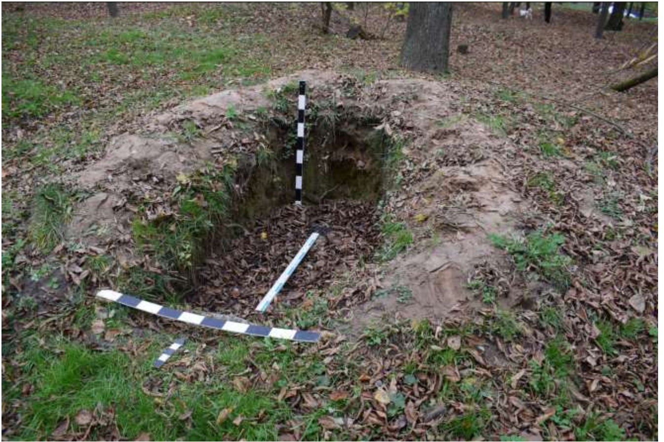
Додаток 5. Пошкодження курганного могильника Болдині гори, внаслідок будівництва фортифікаційних споруд, під час війни з російською федерацією.