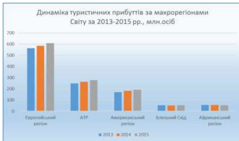
Рис. 2. Динаміка туристичних прибуттів за макрорегіонами Світу за 2013-2015 рр.

Як бачимо, (рис.2) Європейський регіон був і залишається головним локомотивом розвитку туризму в Світі як за кількістю туристичних прибуттів, так і за динамікою цього процесу. Така ситуація обумовлена цілою низкою чинників, серед яких особливо виділяються об'єкти культурної спадщини, розвинена інфраструктура, рівень життя жителів регіону, суспільно-географічний масштаб можливостей та інше.