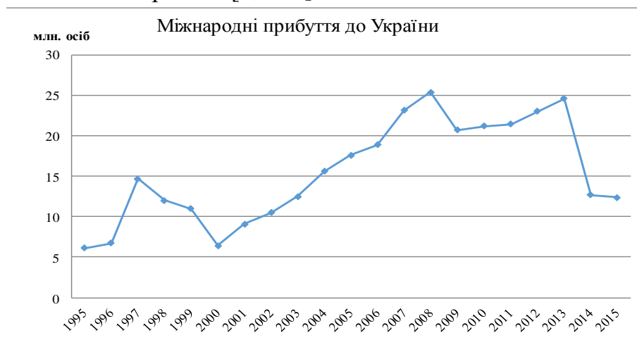
Рис. 3. Міжнародні прибуття до України (1995-2015 рр.)

Тому економічна безпека посідає сьогодні чільне місце в переліку основних функціональних складових будь-якого підприємства. Саме від ступеня її забезпечення в більшості випадків залежить рівень протистояння виникаючим загрозам, створення необхідних для оптимального функціонування умов та визначення передумов подальшого розвитку підприємства. Місце цієї дефініції серед функціональних складових діяльності підприємства представлено на рисунку. На рівні суб'єкта господарювання вченими доведено, що «економічна безпека» як агрегована категорія – це відповідний стан суб'єкта господарювання, його властивість та специфічна діяльність структурних складових, здатність до самореалізації та контролю» [1, с. 8].