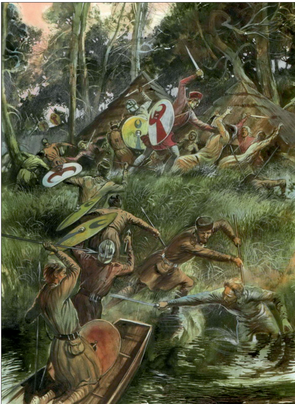
Іл. 2. Художнє зображення висадки римлян на терени варварів, дислокованих на фронтірі Імперії. Автор ілюстрації Д. Емблтон.

Прокліани. Зауважимо, що командир при цьому здійснював маневри з метою посилення одного з флангів відведеного корпусу. Наслідки дій Коментіола підсумував Феофілакт, вказуючи на те, що «усе військо, зрозумівши план стратиґа, прийняло рішення втікати» (Theophylact 1986, р. 234). Незважаючи на це, просування кочовиків припинилось досить швидко. Причиною цього слугувало поширення серед аварів моровиці. Як наслідок, поміж сторонами було укладене перемир'я, за яким «Істр визначався межою річкою». Окремим постулатом визначалась сплата Константинополем 20 тис. солідів кагану (Theophylact 1986, р. 236).