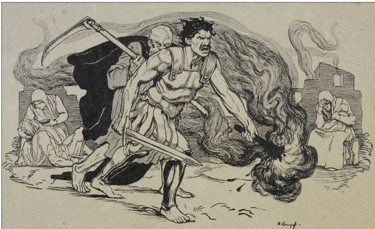
Іл. 13. А. Кампф «Алегорія війни», літографія, 210x287 мм. Музей Ханенків, Київ, 525-ГР МХ.

тло можна інтерпретувати водночас як територію, над якою воєк має певний контроль, та джерело потенційної загрози. Образ солдата у цьому випадку вказує не стільки на триумф німецького воєка над ворогом, скільки на самовіддану службу попри складні обставини.