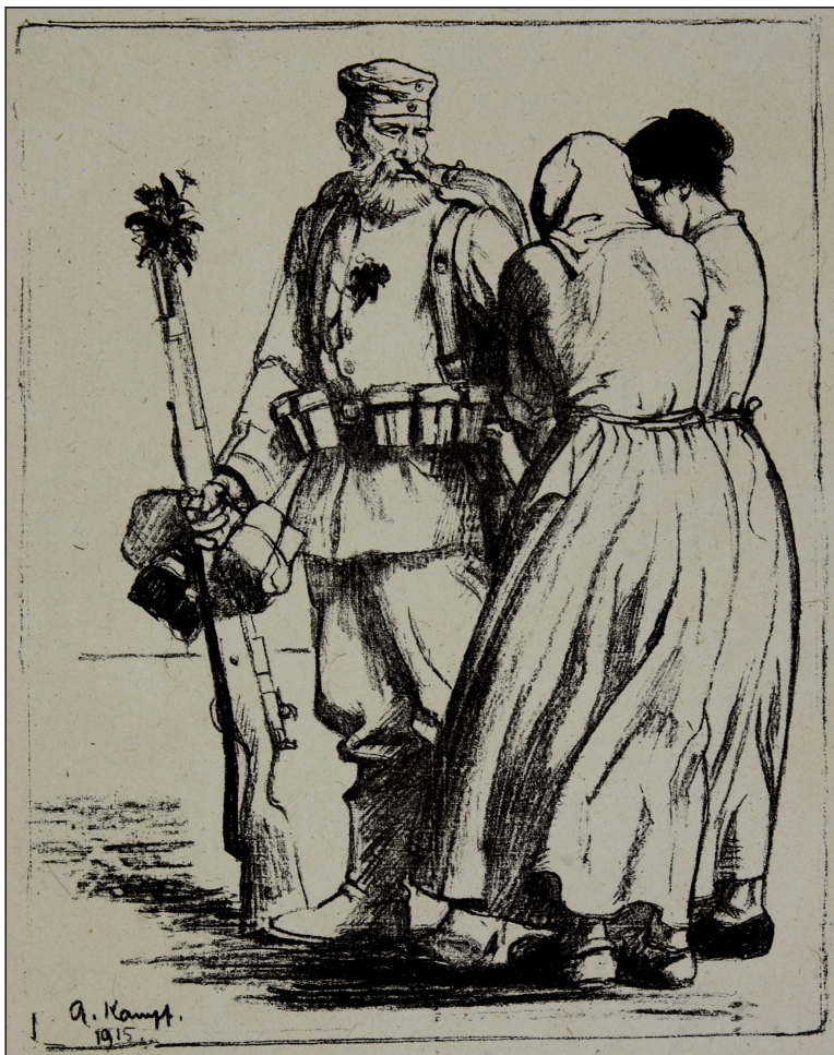
Іл. 8. А. Кампф «Прощання», 1915, літографія, аркуш – 500х364 мм, друк – 238х190 мм. Музей Ханенків, Київ, 1405-ПН. 528-ГР МХ.

солдата: персонажі продовжують виконувати свій обов'язок, діючи злагоджено, попри небезпеку та душевний біль від загибелі товариша (Fox 2018, р. 36).