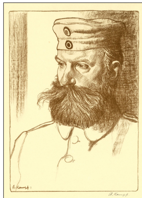
Іл. 7. А. Кампф «Солдат у безкозирці», між 1915 та 1917, літографія, Кабінет гравюр Kupferstichkabinett), Берлін, 164–1917.

Ще один приклад ідеалізованого підходу до репрезентації солдата – зображення «Смерть князя Фрідріха Вільгельма цур Ліппе під час штурму Льєжа». Його репродукція була опублікована у журналі «Daheim» («Вдома») на початку 1915 р. (іл. 5). Загибель князя не здається ані потворною, ані болісною. Самої рани не видно, його обличчя не виражає страждань. Прикметно, що на передньому плані розташований не загиблий, а його побратим, що тримає прапор. Два інші солдати продовжують стріляти, не звертаючи уваги на цур Ліппе. Сцена належить до тих, що оприявнюють «особливу» моральнісність німецького