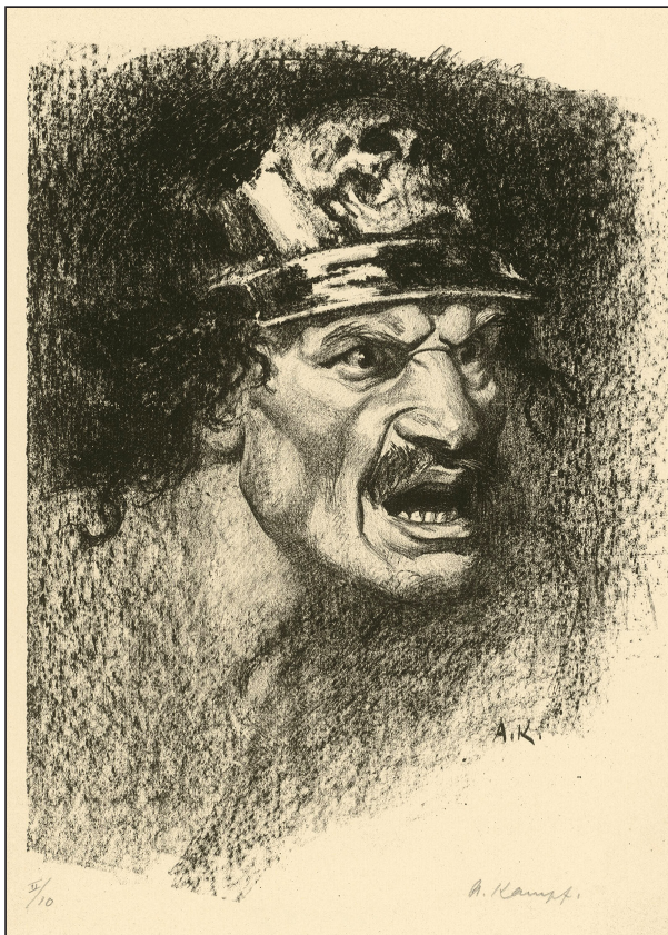
Іл. 12. А. Кампф «Маска воїна в шоломі», до 1917, літографія, Кабінет гравюр (Kupferstichkabinett), Берлін, 173–1917.

ремоги та панування над власними емоціями (Völker 2014; Fox 2018).