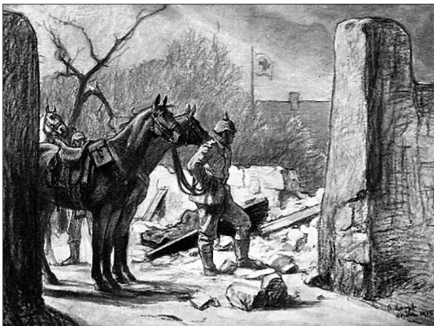
Іл. 2. А. Кампф. Репродукція малюнка, березень 1915. Die Kunst für alle , 31(1915–1916), s. 238. [Online]. Available from: https://digi.ub.uni-heidelberg.de/diglit/kfa1915_1916/0262/image

До термінологічного апарату цього дослідження належать такі поняття, як репрезентація, образ ворога та субституційна дія образу. Перший термін можна розуміти як більш чи менш правдоподібне відображення об'єктивної реальності або ж одне з уявлень, що визначають суб'єктивне сприйняття людиною тих чи інших подій, явищ, процесів. У контексті нашого дослідження релевантними є обидва підходи. Ми враховуємо також тезу про те, що здатність створювати і поширювати репрезентації є проявом суспільної влади (Burke 2008, р. 30, 77, 82, 132; Mitchell 1994, р. 423–424). Термін «субституційна