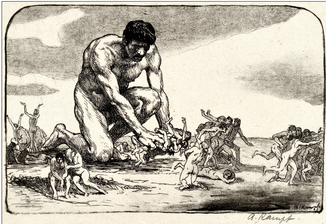
Іл. 11. А. Кампф «Гігант, що душить людей», до 1917, літографія, Кабінет гравюр (Kupferstichkabinett), Берлін, 174–1917.