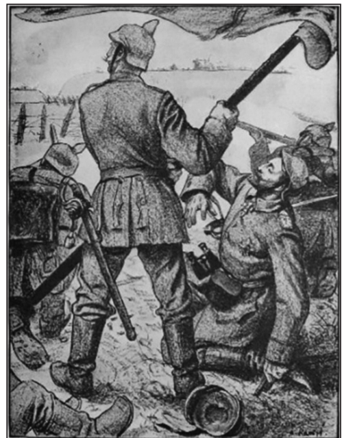
Іл. 5. А. Кампф «Смерть князя Фрідріха Вільгельма цур Ліппе під час штурму Льежа», репродукція малюнка. Daheim, mit. III, 1(1915) . [Online] Available from: https://www.deutsche-digitale-bibliothek.de/item/2E7CUUCT4JP2LBQN4WGHEAJCFXSX5IVW .

Ще до того як потрапити на фронт у січні 1915 р., А. Кампф звернувся до воєнної тематики у кількох гравюрах. Вірогідно, найбільшим ранньою із них була літографія, що з'явилася у першому номері мистецького часопису «Kriegszeit» («Воєнний час»), опублікованому 31 серпня 1914 р. (іл. 1). Німецький солдат стоїть на тлі руїн, з яких піднімається дим. Його поза (контрапост) та погляд, спрямований убік, нагадують зразки античної пластики. У правій нижній частині зображення спиною до глядача лежить тіло чоловіка у цивільному одязі. Гравюру супроводжує вірш, який поміщає сцену у історичний контекст – завоювання бельгій-