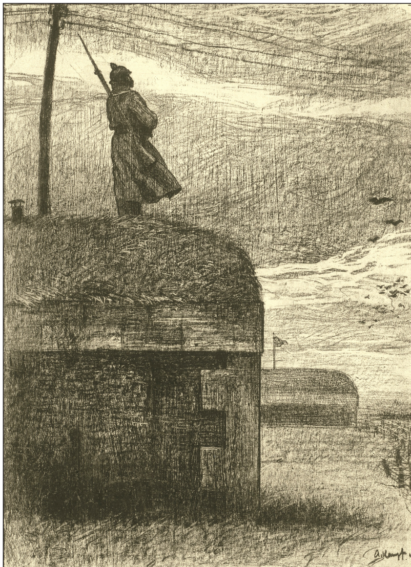
Іл. 10. А. Кампф «Вартовий на укріпленні», до 1917, літографія, Кабінет гравюру (Kupferstichkabinett), Берлін, 162–1917.

На літографії «Прощання з солдатом» (іл. 8) А. Кампф зобразив солдата з родиною. Жінки стоять спиною до глядача. Фігура у хустці схилила плечі, її руки приховані: можна припустити, вона витирає сльози. Вираз обличчя солдата можна трактувати як сумний і замислений, однак він втримується від відкритої демонстрації емоцій. Цю тенденцію простежуємо також на прикладі ілюстрації А. Кампфа до «Міцної фортеці»: оплакуючи загиблих, солдати стримано схиляють голови перед могилою, складаючи руки у молитві (іл. 9). Самоконтроль як жінок, так і чоловіків на цих зображеннях, їхня відданість родинам і товаришам відповідає наративам воєнного часу про виняткову моральність німецької нації, найяскравішим втіленням якої є її військо. Йдеться у першу чергу про готовність принести себе або близьку людину заради пе-