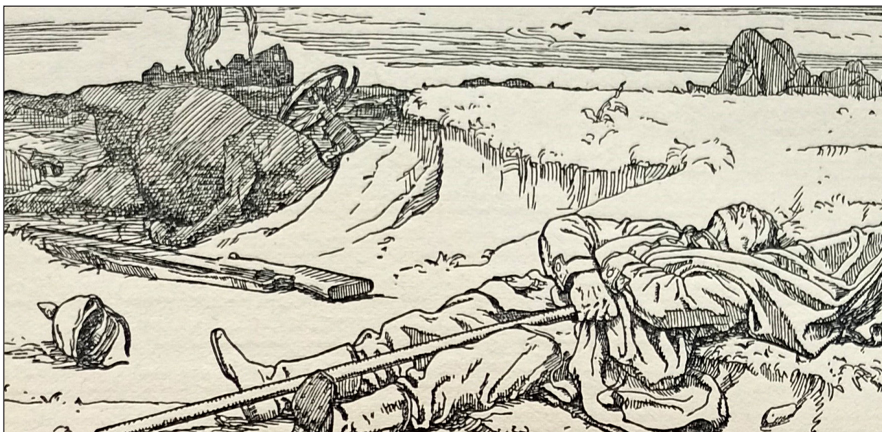
Іл. 6. А. Кампф. Ілюстрація до збірки «Міцна фортеця», 1914 (Doehring 1919/1920, s. 83).

іл. 1. Однак у цьому випадку художник залишає загиблих або поранених «за кадром».