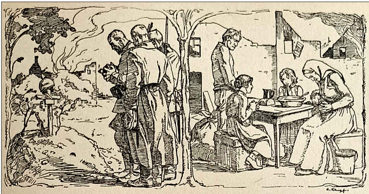
Іл. 9. А. Кампф. Ілюстрація до збірки «Міцна фортеця», 1914 (Doehring 1919/1920, s. 229).

Роботи, виконані у 1915 р. та пізніше, відрізняються більшим жанровим та тематичним різноматтям. Єдиним відомим на сьогодні твором графіки досліджуваного періоду, у якому художник показав бойові зіткнення як такі, є начерк туш-