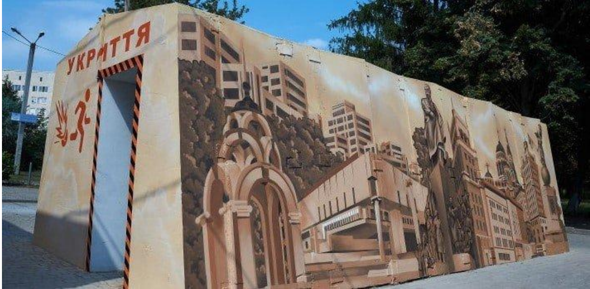
Рисунок 2. Зупинка-укриття у місті Харків.

інформаційний центр» та громадською організацією «Смарт Медіа» проєкт «Зупинка укриття» (рис. 2). Такі зупинки призначені для захисту людей від обстрілів під час очікування транспорту. Вони мають бетонну конструкцію та армований каркас, здатні вмістити до 25 людей. На момент написання статті в місті встановлено 14 зупинок-укриттів (Official Site of Kharkiv City, 2025).