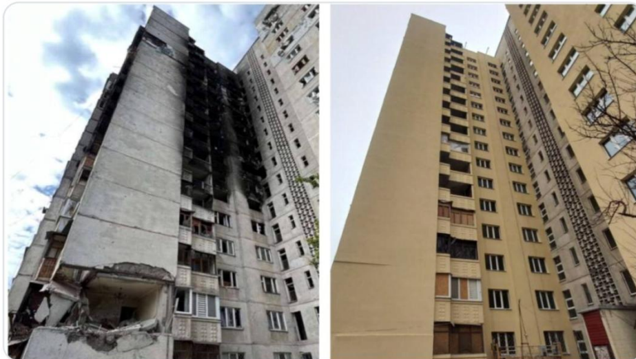
Рисунок 3. Приклад відновленого будинку по вул. Метробудівників, 5, м. Харків.

Від початку повномасштабного вторгнення було пошкоджено понад 130 об'єктів Харківських теплових мереж, зокрема котельні, центральні теплові пункти та майже 21 км тепломереж. У відповідь на воєнні виклики в місті розпочато впровадження автономних джерел теплопостачання: введено в експлуатацію 41 когенераційну газову установку та 36 блочно-модульних котельень. Як і звичайні ТЕЦ, когенераційні установки одночасно виробляють тепло- та електроенергію, але роблять це у менших масштабах. Це дозволить окремим громадам мати безперебійне теплопостачання в умовах аварійних або планових відключень електрики. Окрім цього, модернізовано понад 510 км тепломереж (Official Site of Kharkiv City, 2025). Попри продовження атак на критичну інфраструктуру, фахівці системно працюють над її оновленням, забезпечуючи безперервне теплопостачання для мешканців навіть в умовах воєнної нестабільності.