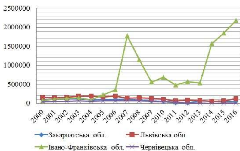
Рис. 1. Динаміка туристичних потоків Карпатського регіону

Виклад основного матеріалу. Туризм в Карпатському регіоні активно розвивається, про що свідчать високі показники туристичних потоків. Одним із лідерів за цим показником є Івано-Франківська область, що пов'язано із стрімким розвитком курорту Буковель та великою кількістю екскурсантів (рис. 1) [9-12]. Окрім того, у 2016 р. у кожній із областей Карпатського регіону спостерігається збільшення кількості туристів, що можна пояснити розвитком внутрішнього туризму. Туристів в тому числі приваблюють гастрономічні фестивалі.