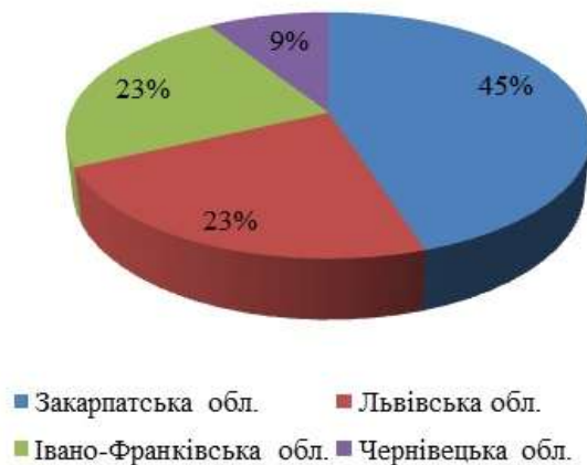
Рис. 2 Співвідношення гастрономічних фестивалів по областях Карпатського регіону

Таким чином, найбільше гастрономічних фестивалів проводять у Закарпатській області (45 %), друге місце посідають Львівська та Івано-Франківська області (по 23 % відповідно), найменше таких фестивалів (9 %) проводять в Чернівецькій області (рис. 2).