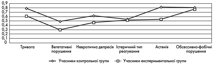
Рис. 3. Показники проявів деструктивного перфекціонізму у ситуації досягнення для учасників корекційної програми та досліджуваних контрольної групи

повторний зріз для 12-ти учасників програми за вказаними вище методиками. У діаграмі на рис. 3 представлено результати порівняльного аналізу показників невротичних проявів для учасників контрольної та експериментальної груп.