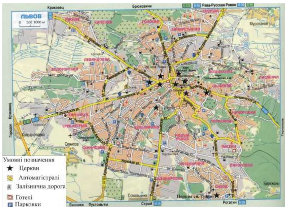
Рис. 1. План-схема розташування дерев'яної церкви Святої Трійці

Львова, не мотивує звичайних перехожих туристів до відвідування чудом вцілілої невеликої дерев'яної церкви, тому бальна оцінка розташування пам'ятки відносно основного туристичного центру рівна 6-ти балів (див табл. 1.) та рис. 1. Церква розташована на підвищенні в рельєфі та добре проглядається зі всіх сторін, оточена вічнозеленими туями та добре упорядкованим подвір'ям. Багатоповерхівки не заступають виду на церкву, тому можна оцінити архітектурно-ландшафтну відповідність найвищим балом (див.рис.2.). Церква Святої Трійці не міняла місця розташування впродовж всієї своєї історії. За останніми даними, знайденими в архівах міста Кракова, церкву спорудили мешканці села Сихів 1600 р., а не 1654 р., як вважали раніше. У 1870-х рр. до церкви був прибудований притвор, а також підведені підвалини [2]. Єдиним негативним моментом стала її реставрація проведена у 1932 р. з частковим порушенням автентики (розібрана дзвіниця над бабинцем) [ 3], тому бальна оцінка автентичності зменшилась до 8-ми (див.табл.1.).