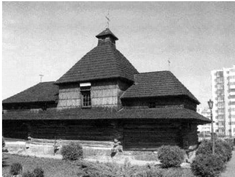
Рис. 2. Церква Святої Трійці міста Львова

Будучи типовим зразком архітектури XVII ст., сихівський храм має будову однонавову, тридільну будову, з однією банею [6]. Дзвіниця надійно схована була під банею, що зустрічалось дуже рідко в дерев'яній архітектурі того часу і на сьогоднішній день не збереглася на жаль. Тільки на рисунках В.Січинського ми можемо побачити її наявність (див. рис.3.).