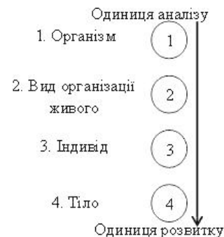
Рис. 1. Ряд рівнів конкретизації (організації) живого

Як показує аналіз, у межах предметної дискусії, що розгортається на базі "тріумвірату" категорій, із поля зору випадає не лише категорія "душа", але також одне із проміжних між організмом та індивідом поняття "вид" (біологічний). Наведене вище визначення організму, з урахуванням предметної специфіки психологічного дискурсу (тобто ігнорування більш специфічного до порушеної проблематики біологічного дискурсу) при визначенні поняття "вид" дозволяє обмежитись означенням – вид живого організму (форми організації живого). Тоді змістове навантаження терміна індивід – конкретний (утілений) вид форми організації живого, а терміна тіло – матеріальний носій організму (див. рис. 1).