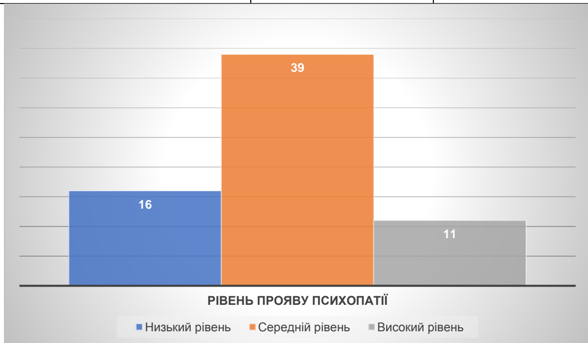
Рис. 3.2. Рівень прояву психопатії

Рівень психопатії представлений у табл. 3.7, показав, що переважна більшість респондентів (59,1%) мають середній рівень цієї риси, що може свідчити про помірну схильність до ризикованої поведінки та знижену