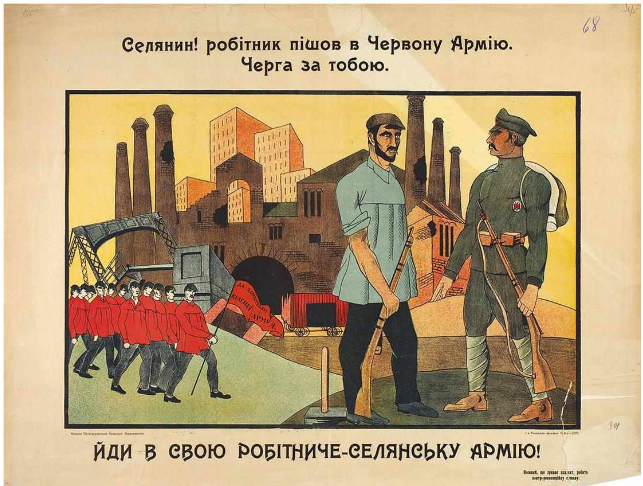
Іван Падалка. «Селянин, робітник пішов в Червону Армію. Черга за тобою», 1920 р.