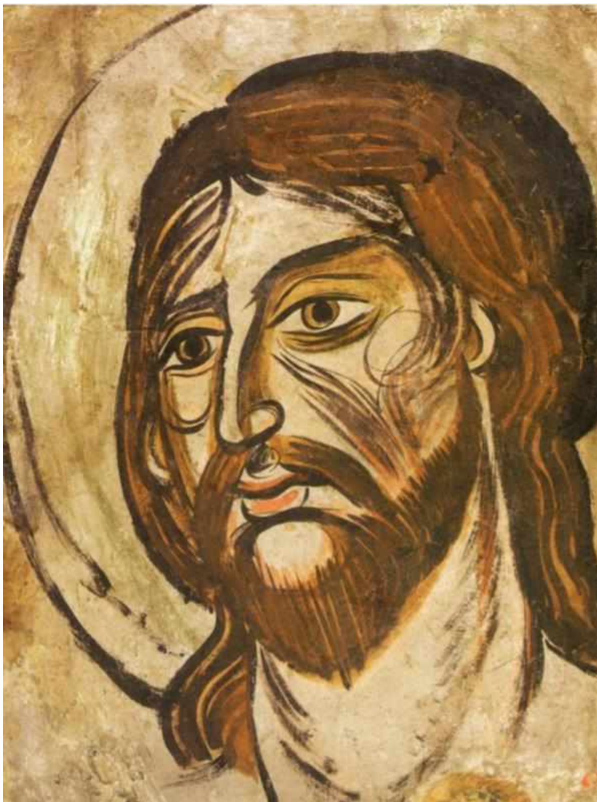
Михайло Бойчук. «Голова Спасителя», 1910-ті рр.