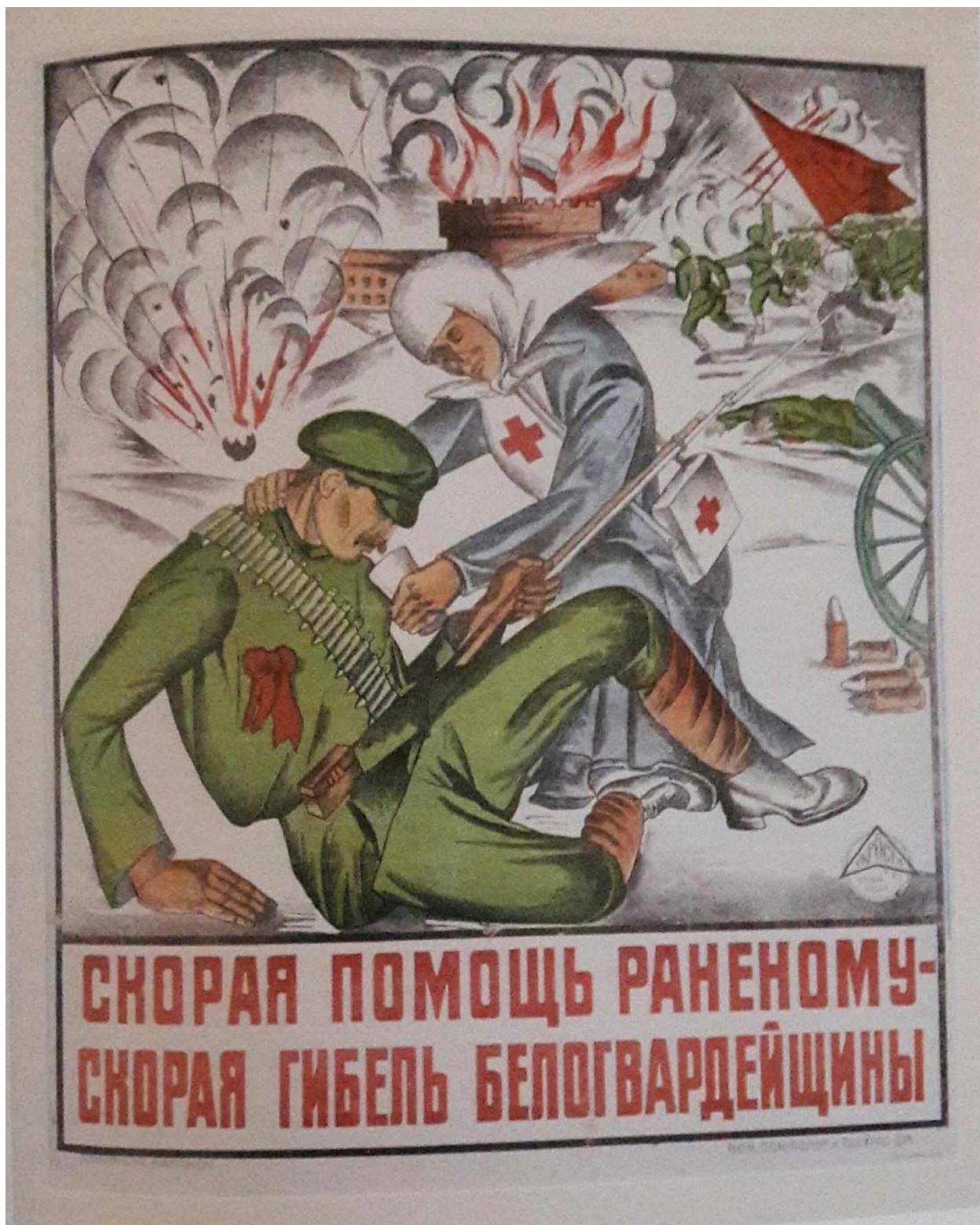
Іван Падалка. «Швидка допомога пораненому – швидка загибель білогвардійщини», 1921 р.