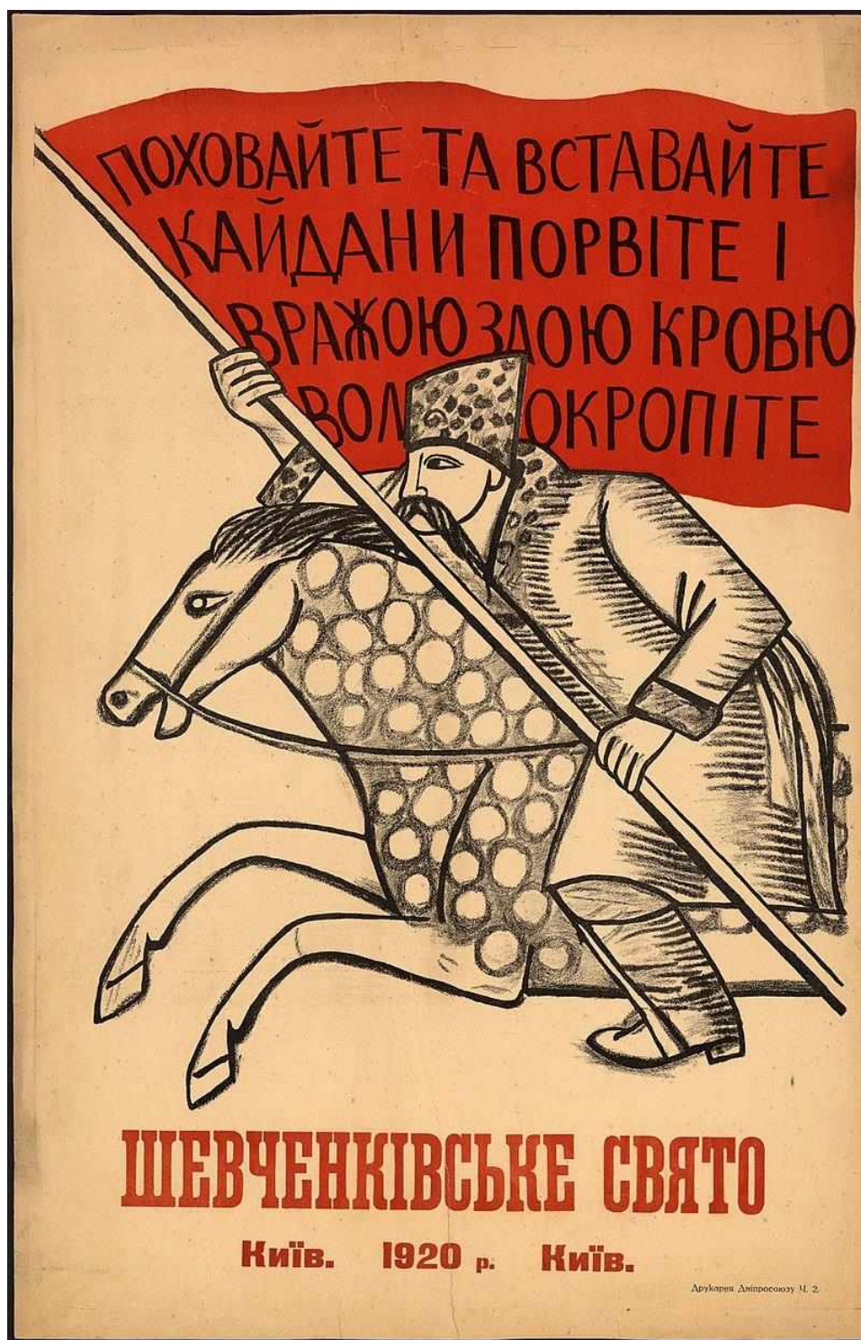
Михайло Бойчук. «Шевченківське свято», 1920 р.