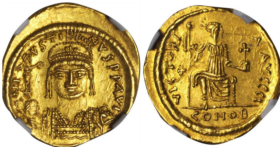
Іл. 1. Східноримський імператор Юстин II (565–578), зображений на аверсі соліда. Монетний двір Константинополя, бл. 571 р. Легенда на аверсі: «D[omi]N[us] IVSTINVS P[ater] P[at]riae AVG[ustus]» [лат. «Володар Юстин, Батько Батьківщини, Великий»]. Легенда на реверсі: «VICTORIA AVGGCCCC» [лат. «Перемога чотирьох августів»], нижче – «CON[stantinopolis] OB[RYZA]» [лат. «Константинополь. Чисте золото»]. Переклад легенди та датування наше.

Формально авари обороняли Імперію, про що звітували автократору у ході посольства за 562 р. (Menander 1985, р. 50–53). Тим не менш, на практиці у середовищі знаті кочовиків почав вироблятися зовнішньополітичний курс, спрямований на відхід від лінії Східного Риму. Упродовж 558–562 рр. номади, без попереднього узгодження з імператором, здійснили низку походів на гепідів та антів. У 561 р. кочовики розпочали кампанію супроти франкського королівства Австразія, очолюваного Сигібертом I (561–575) (Gregorii 1836, р. 215). Бойові дії супроти формальних федератів Риму та нейтральних сторін виступили demonstratio ad oculos майбутнього демаршу аварів супроти Константинополя.