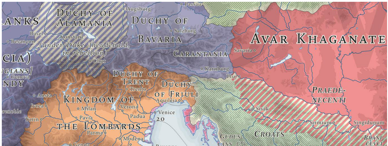
Іл. 3. Кордон Королівства лангобардів та Аварського каганату після переселення Альбоїна з Паннонії та Норіку до Апеннінського півострову.

3) отримання Альбоїном союзника з широким оперативно-тактичним інструментарієм на полі бою.