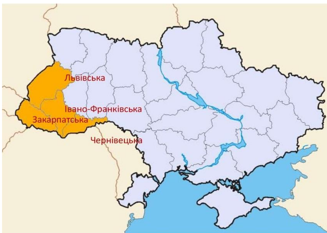
Рис. 5. Карпатський регіон на карті України [36].

В Карпатському регіоні існує ряд проблем економічного, соціального, екологічного характеру, проте найбільшого навантаження природі Карпат надає промислова та сільськогосподарська діяльність, видобувна промисловість (шахти, кар'єри); вирубка лісів, яка супроводжується появою ерозій, руйнуванням родючого шару ґрунту, появі селевих потоків та повеней, зсувів ґрунту, автотранспортна та залізнична галузі забруднюють атмосферне повітря, дія електромагнітних полів, міграція, тощо.