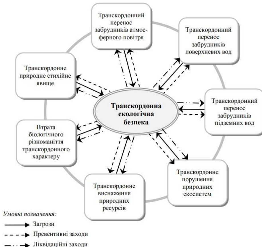
Рис.2 Чинники транскордонної екологічної безпеки [8]

Питанням екологічної небезпеки транскордонного походження та подоланням їх наслідків займалася професор та доктор економічних наук Г. Обиход, яка вважала, що господарська діяльність, що здійснюється на суміжних територіях, потенційно може стати джерелом загроз та небезпек, тому у прикордонних регіонах особлива увага повинна приділятися дотриманню низки принципів, серед яких: запобігання шкоди та належна обачність