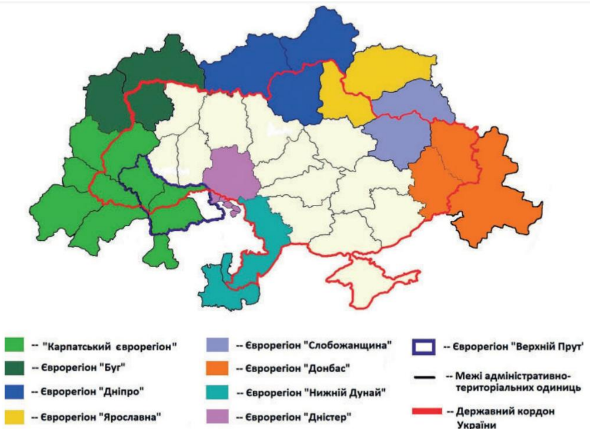
Рис . 4. Євро регіони України [35].

Правову основу транскордонного співробітництва складає Конституція України, міжнародні договори України, Закони України, міждержавні угоди.