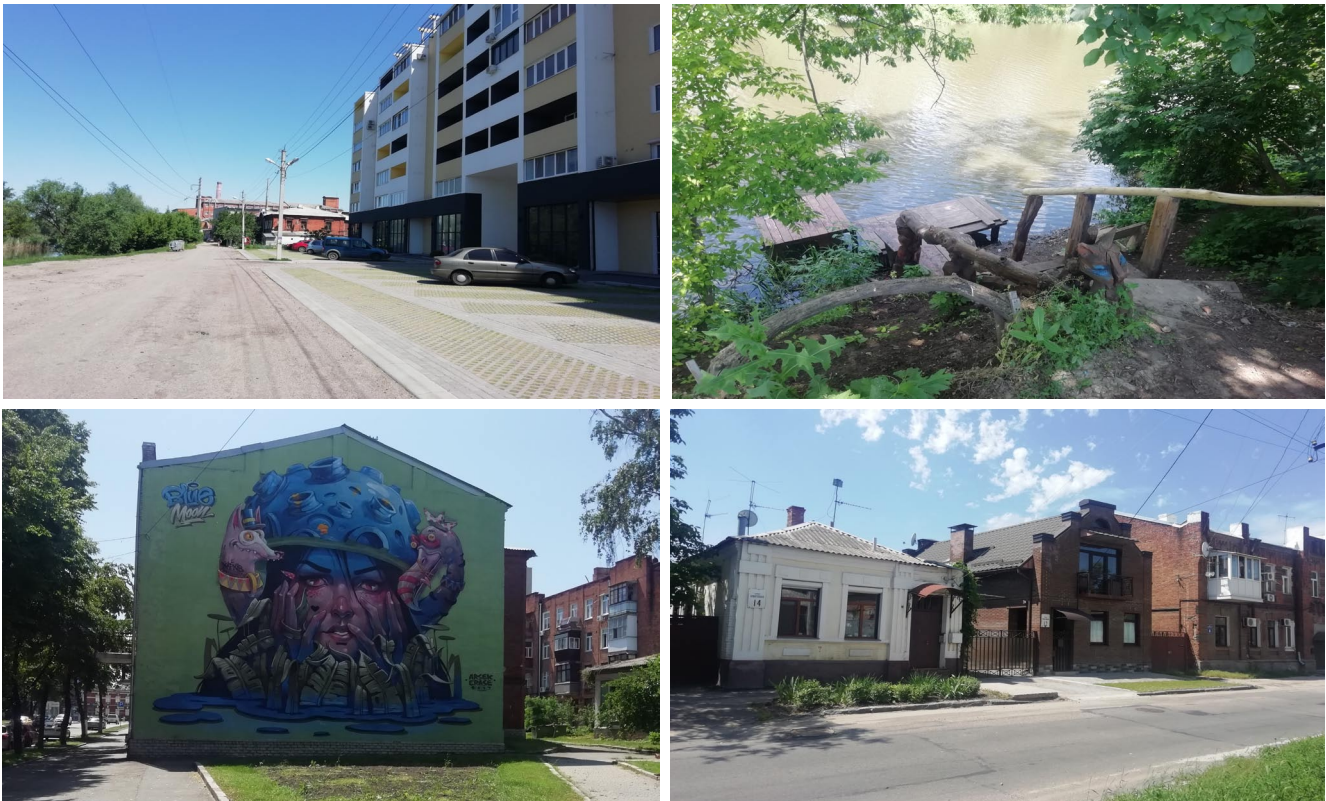
Рис. 5. Житловий комплекс «Річний квартал», місце відпочинку на набережній річки Харків, мурал, реконструйовані фасади будівель, вул. Примерівська

підвищити конкурентоспроможність даного ареалу, де проводилось дослідження: