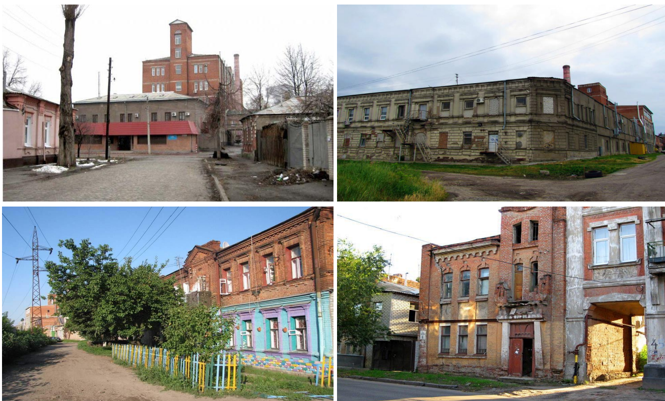
Рис. 3. Промислова зона по вул. Юр'ївській (територія колишньої фабрики №5) та житлові будинки навколо, вул. Франківська та Примерівська (Kharkov: New about familiar places, 2020)