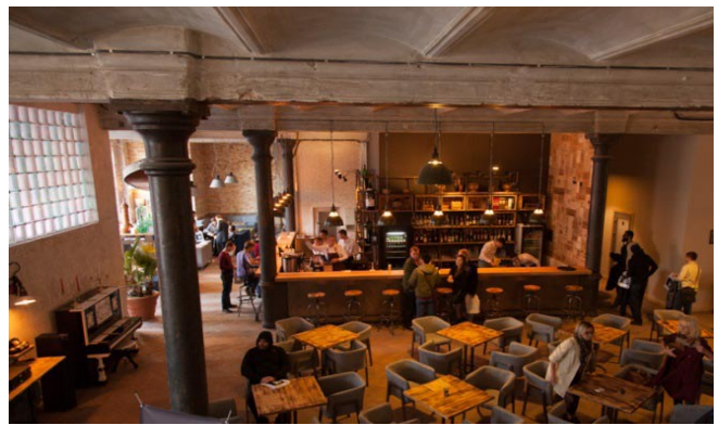
Рис. 1. Арт-завод «Механіка» та Fabrika.Space (Niemets et al., 2018)