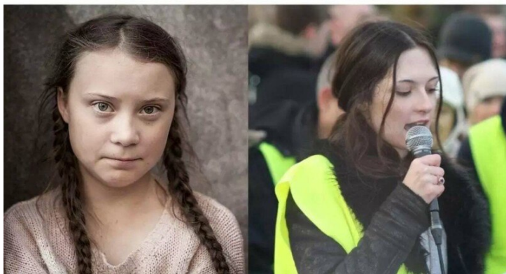
Грета Тунберг после пары дней в России: