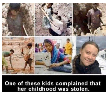
One of these kids complained that her childhood was stolen.