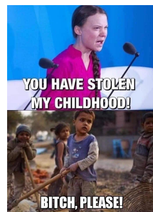
YOU HAVE STOLEN MY CHILDHOOD!