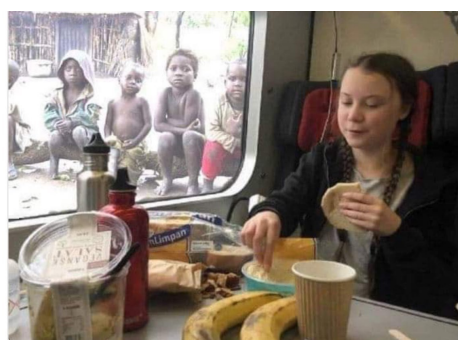
«Вы украли моё детство.»

змінам клімату у Нью-Йорці: «Ви вкрали моє майбутнє!». У таких мемах особистість Грети протиставляється образам дітей з відверто бідних прошарків суспільства африканського та азійського регіонів, які вимушені фізично працювати з раннього віку, знаходячись на порогах крайньої бідності. Від так, такі меми актуалізують у суспільній свідомості глобальні проблеми дитячої праці, дитячої бідності, глобальної освіти, смертності та експлуатації дитячої праці, відсутності рівності та верховенства права, голод у світі, порушення прав людини (дитини), нетрів, недоїдання, соціалізації дітей та порогів крайньої бідності, які є зафіксованими чинними органами Організації Об'єднаних Націй як найгостріші глобальні проблеми сьогодення. Автори таких мемів вказують на рівень достатку Грети, тим самим знічуючи її слова, і вказуючи «у кого насправді вкрали дитинство».