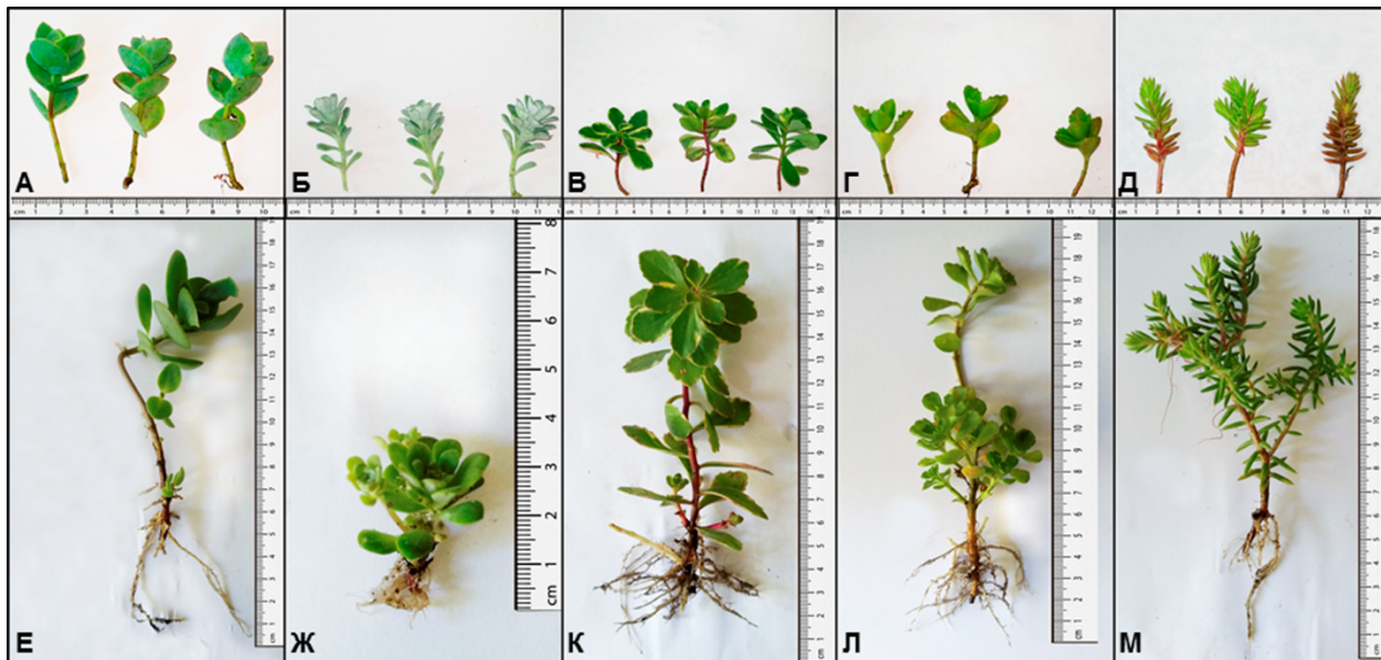
Рис. 2. Живці та вкорінені рослини видів роду Sedum :

даткових коренів відображає здатність рослин до консолідації субстрату. За нашими даними, три види – S. ewersii , S. kamtschaticum 'Variegatum', S. spurium – мали вищу здатність розвивати підземні органи та додаткові корені. Наприклад, живці S. spurium на 86 день експерименту мали підземні кореневища 78,89 ± 4,86 мм завдовжки, а об'єм їхніх коренів сягав 3,19 ± 0,36 см 3 (рис. 1).