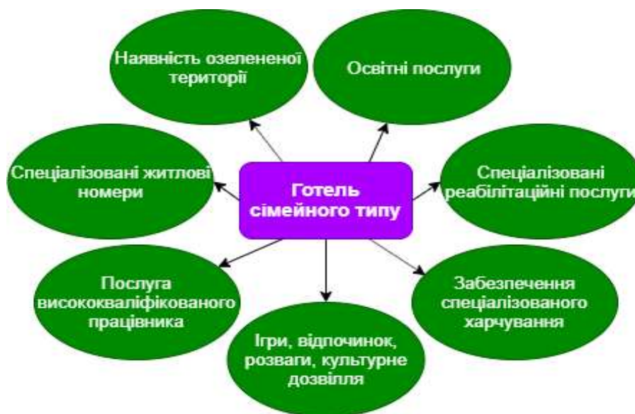
Рис. 2. Основні переваги готелю сімейного типу

Більшість людей уже готові прийняти таких дітей і сприяти їх успішному зростанню та становленню як особистості: створюються приватні садочки, школи, центри реабілітації, різноманітні розвиваючі програми для дітей та тренінги для батьків. Однак, ще досі в Україні нема жодного спеціалізованого готелю, в якому б надавалися послуги для дітей з РАС та їхніх сімей. В Україні сім'ї з аутичними дітьми також прагнуть відпочивати, а натомість вимушені вдовольнятися стандартними пакетами послуг, які не передбачають догляд за особливими дітьми. Та найчастіше вони взагалі не зупиняються в готелях, щоб не привертати зайвої уваги. Необхідно змінити дану тенденцію і зробити відпочинок для батьків та реабілітацію для дітей з аутизмом перспективним напрямком розвитку сімейного відпочинку. Для вирішення цієї проблеми ми пропонуємо розробити та впровадити спеціальні реабілітаційні послуги для особливих дітей в готелі. Тоді все буде направлено на комфорт та розвиток дитини і відпочинок батьків: групові та індивідуальні розвиваючі заняття, послуги психолога, масажиста, зал для реабілітаційних занять, спеціальне планування та особливості інтер'єру номерів, здорове харчування, різноманітні пакети послуг тощо.