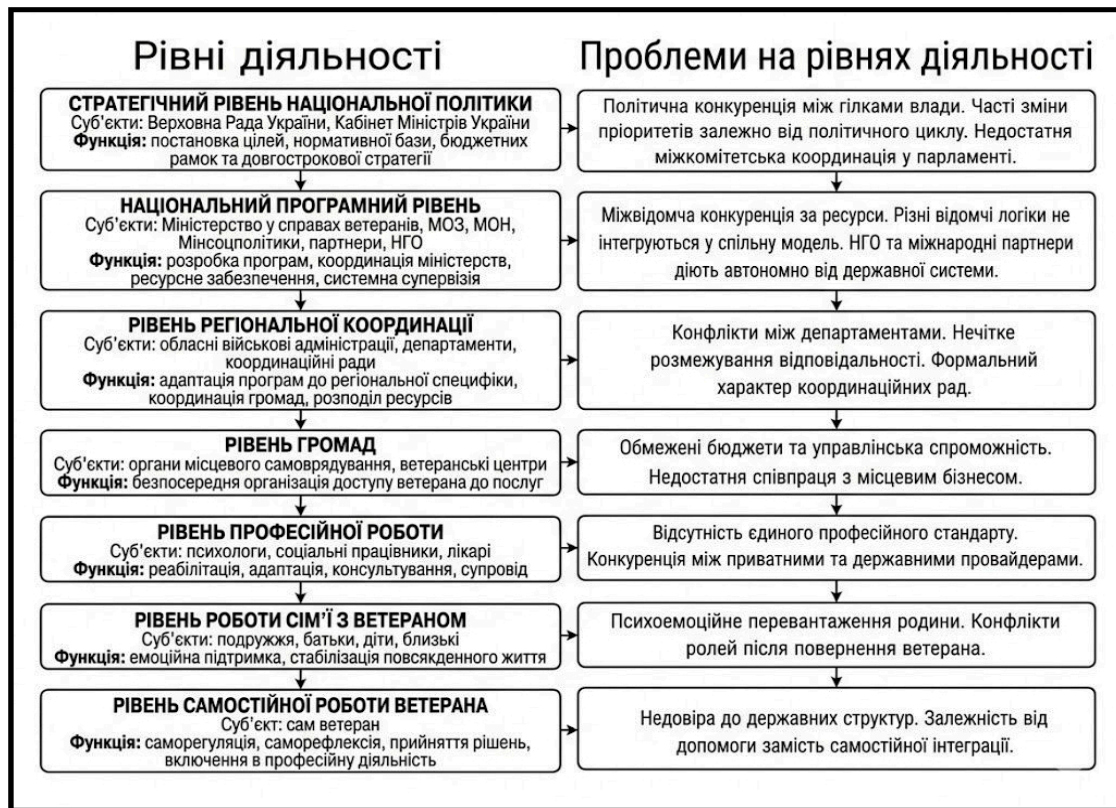
Рис. 1. Схема проблем у діяльності з підтримки ветеранів.

Функції. Розробка програм, стандартів, механізмів фінансування, методичних матеріалів, систем моніторингу.