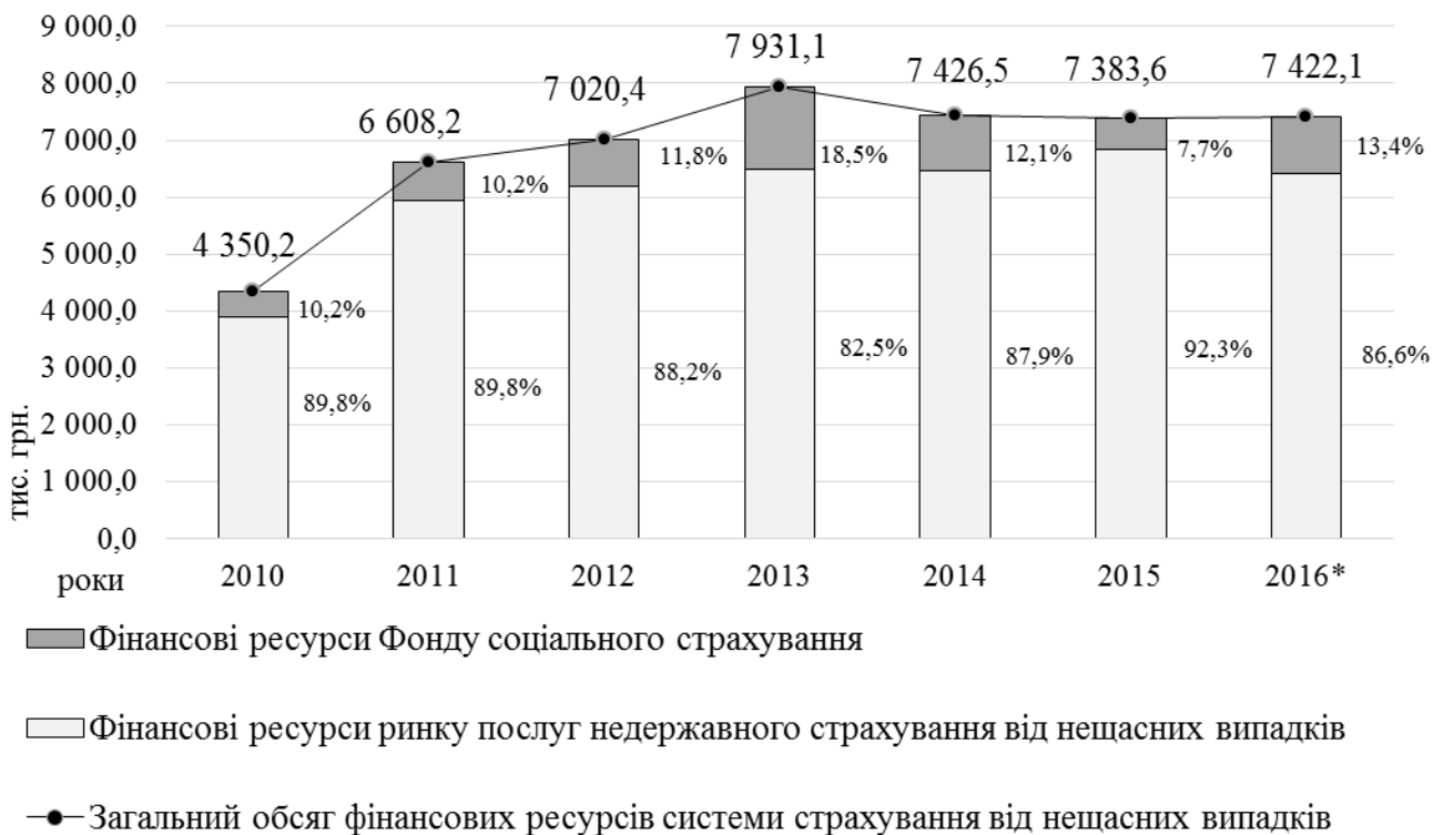
Рис. 2 Структура фінансових ресурсів системи страхування від нещасних випадків України у 2010-2016 рр., тис. грн.

Макрофінансовий аналіз місця та ролі системи страхування від нещасних випадків показав, що вона акумулює та перерозподіляє значний обсяг фінансових ресурсів: в досліджуваному періоді – від 4,4 млрд. грн. у 2010 р. до 7,9 млрд. грн. у 2013 р. Левова частина цих коштів припадає на державне соціальне страхування: від 82,5 % у 2013 р. до 92,3 % у 2015 р. (рис. 2). Частка недержавного страхування від нещасних випадків є значно меншою: вона коливалася від 7,7 % у 2015 р. до 18,5 % у 2013 р. Ці дані свідчать про те, що недержавне страхування від нещасних випадків має резерв розвитку, потенціал якого в сучасних умовах використовується недостатньо повно.