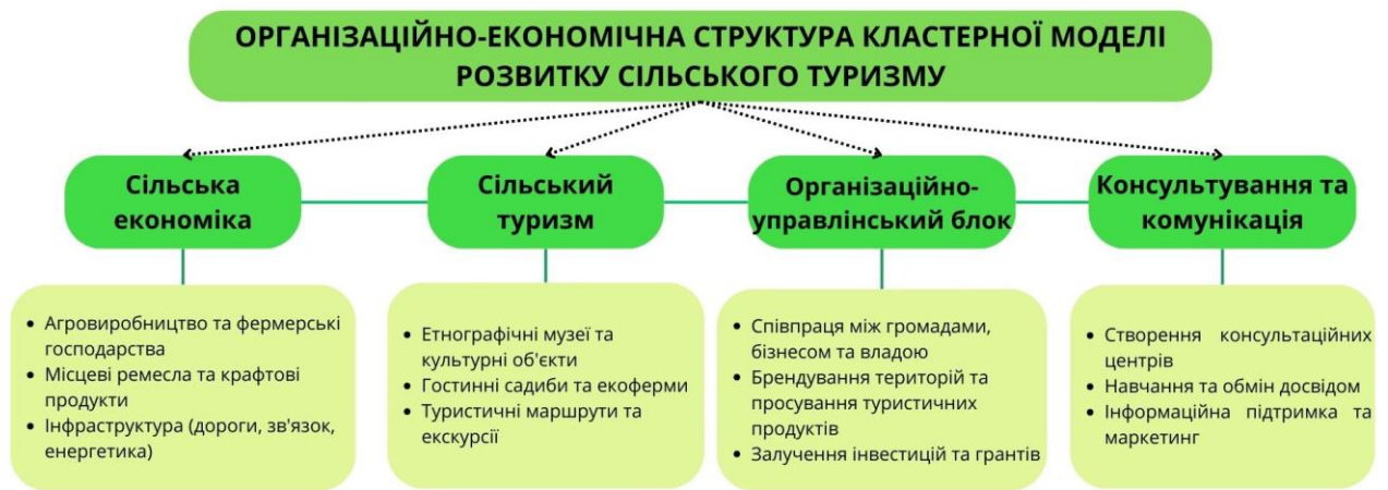
Рис.1 Організаційно-економічна структура кластерної моделі розвитку сільського туризму (складено автором)

Запропонована нами стратегія ґрунтується на принципах сталого розвитку, широкого партнерства та адаптивного управління, а її зміст структуровано за кількома ключовими елементами. В основі стратегії лежить узгоджене бачення майбутнього сільського туризму, сформульоване за результатами проведеної під час хакатону в Черкаській області «Co-creation»-сесії за участі представників місцевого бізнесу, органів влади, освітніх закладів та громадських організацій. Таке бачення включає як цілісну місію розвитку, так і цінності, на яких має ґрунтуватися туристична діяльність, а саме збереження автентичності, підтримка місцевих ініціатив, інтеграція у регіональні й міжнародні ринки. Однією з основних переваг кластерної моделі є її орієнтація на синергію. У стратегії окреслено пріоритетні напрями взаємодії: розробка спільних туристичних маршрутів і пакетів, просування єдиного бренду території, координація подій і культурних заходів, створення освітніх програм для місцевого населення і туристів. Запропоновано створити Координаційну раду кластеру, яка включатиме представників усіх ключових груп - підприємців, громади, освітян, органів місцевого самоврядування. Така рада буде виконувати функції стратегічного управління, контролю, комунікації та представництва інтересів кластеру на обласному і національному рівнях. Сучасний кластер не може