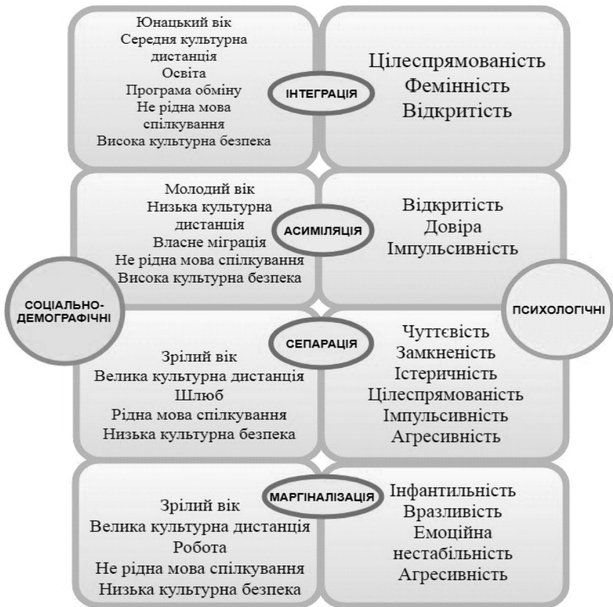
Рис. 3. Сукупність чинників вибору стратегії акультурації